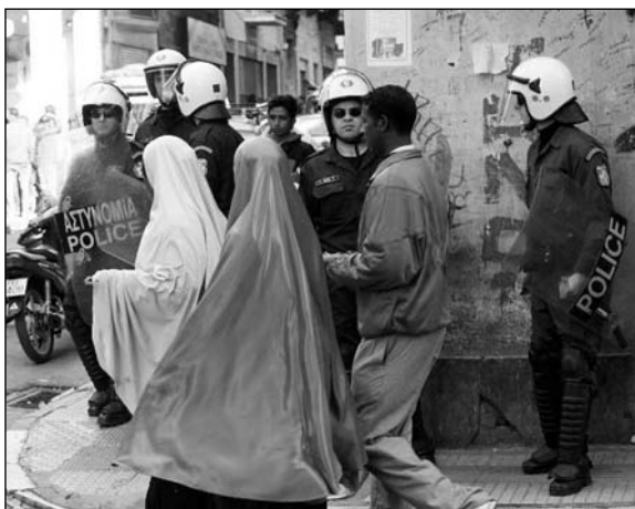
Σκούπα στο κέντρο της Αθήνας, κάπου στα 2009