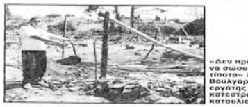
«Δεν προνοούσαν»... Οργάνωση εργατών καταλύσει...