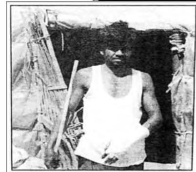
Ένα από τα θύματα της επίθεσης των Αλβανών «νονών» στον οικισμό των εργατών από το Μπαγκλαντές. Όταν ρωτήθηκε ποιος τον πυροβόλησε στο χέρι, αρνήθηκε να μιλήσει.