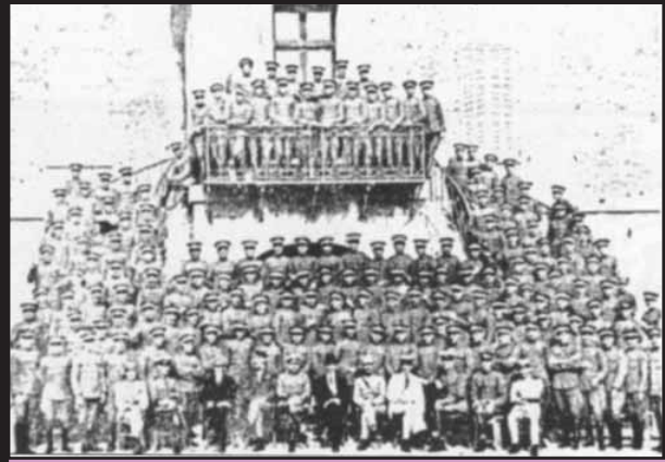
Η σχολή χαφιέδων της Κέρκυρας σε πλήρη απαρτία.

Παρακάτω θα προσπαθήσουμε να πούμε ορισμένα πράγματα για αυτές τις διαδικασίες δίνοντας ειδική έμφαση στη Θεσσαλονίκη. Αυτή η ειδική έμφαση δεν θα πρέπει να παραπλανήσει τους αναγνώστες. Οφείλεται στην ούτως ή άλλως