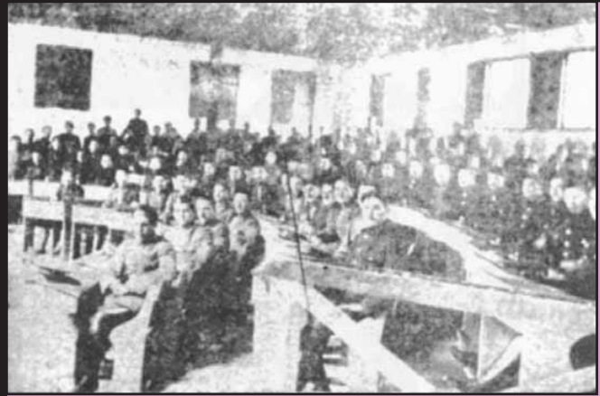
Το αμφιθέατρο της σχολής. Προφανώς οι παρακολουθήσεις ήταν υποχρεωτικές.