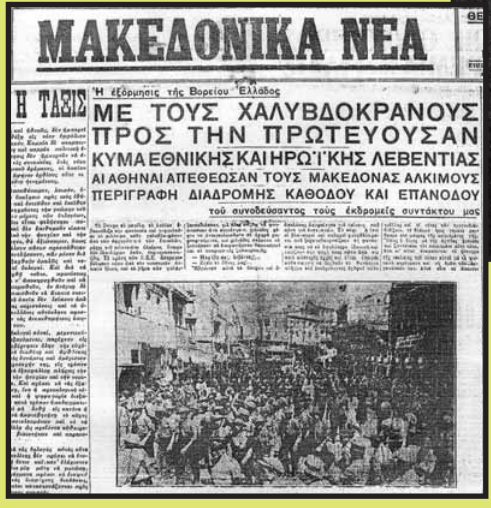
χαλυβόκρανος της ΕΕΕ