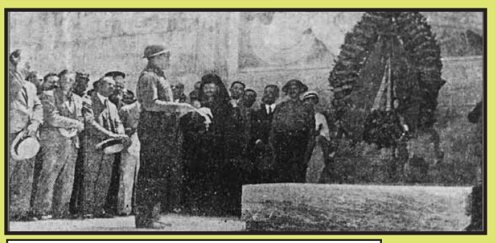
η “κάθοδος” της φασιστικής οργάνωσης ΕΕΕ στην Αθήνα