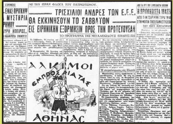
Φώς, 22-06-1933 Η εξόρμηση, τελικά, δεν ήταν αυτό ακριβώς που θα λέγαμε “ειρηνική”...