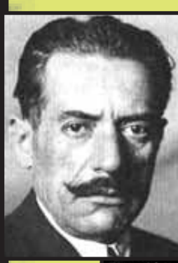
ο παλιοσακαράκας ανφάς...

Στην περίπτωση των ακροδεξιών, όπως έχουμε ήδη αναφέρει, η δράση περνούσε μέσα από την αγκαλιά του κράτους. Αυτό το μοντέλο συμμαχίας θα ακολουθηθεί και αργότερα 4 , με την περίπτωση των δοσιλόγων και ταγματασφαλιτών τη δεκαετία του 1940 να “κλέβει την παράσταση”.