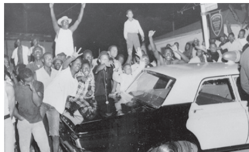
Γουάτς (Λος Άντζελες) 1965