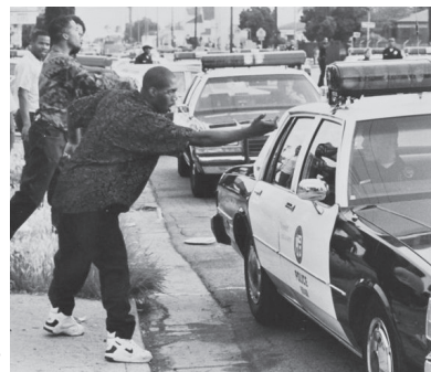
Λος Άντζελες, 1992

«Απ' τον τρόπο που είναι οργανωμένη αυτή η κοινωνία όπου η βία είναι παντού και οργανώνει τα πάντα, θα πρέπει να περιμένετε τέτοιες εκρήξεις. Αν είσαι μαύρος σε τούτη τη χώρα και βγαίνεις έξω στο δρόμο και λευκοί αστυνομικοί βρίσκονται παντού γύρω σου και σε σταματούν συνέχεια, όπως εμένα που κάθε φορά που έβγαινα από το σπίτι με σταματάγανε όλη την ώρα οι μπάτσοι του Λος Άντζελες γιατί ήμουν μαύρη γυναίκα με αυτό το άφρο παρουσιαστικό... τι περιμένετε; Και τώρα ρωτάτε εμένα, αν εγκρίνω τη βία; Μα αυτό δεν βγάζει κανένα νόημα. Με ρωτάτε αν εγκρίνω τα όπλα; Εγώ γεννήθηκα στο Μπίρμινχαμ της Αλαμπάμα. Είχα φίλους και γείτονες που σκοτώθηκαν από τις βόμβες που έβαζαν οι ρατσιστές. Θυμάμαι από τότε που ήμουν πολύ μικρή τον ήχο των εκρήξεων, το σπίτι να δονείται, θυμάμαι που ο πατέρας μου είχε όπλα γιατί ανά πάσα στιγμή κινδυνεύαμε να δεχτούμε ρατσιστική επίθεση. Ο τοπικός κυβερνήτης, τον έλεγαν Μπιουκάναν, έβγαινε στο ράδιο και έλεγε πράγματα όπως: «κάτι αραπάδες μετακόμισαν σε μια γειτονιά λευκών. Να 'στε σίγουροι πως θα χουμε μακελειό το βράδυ». Κι όταν οι ρατσιστές έσπειραν το μακελειό βομβαρδίζοντας την εκκλησία μας, οι άντρες οργάνωσαν νυκτερινές περιπολίες για να προστατέψουν την κοινότητά μας. Γι' αυτό κι όταν με ρωτάνε για τη βία, το βρίσκω σχεδόν απίστευτο, γιατί αυτός που ρωτάει δεν έχει προφανώς καμιά ιδέα για το τι τραβάνε οι μαύροι σε αυτόν τον τόπο, από τη στιγμή που ο πρώτος Αφρικανός δούλος πάτησε το πόδι του σε αυτή τη χώρα».