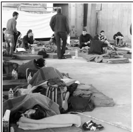
Οι εφημερίδες της Αθήνας το βουλώνουν. Αν από την άλλη ψάξει κανείς τις εφημερίδες, θα δει ότι η "παράνομη" είσοδος στη χώρα συνεχίζεται. Η φωτό είναι από την Καλαμάτα, 10 Απριλίου 2010.

Εν πάσει περιπτώσει και για να μην το παιδεύουμε: αν αυτή τη στιγμή και εν τω μέσω της οικονομικής κρίσης, είναι άγνωστο το τι γίνεται με τους δίχως χαρτιά μετανάστες εργάτες, αυτό δεν οφείλεται στο ότι έπαψαν να υπάρχουν. Όχι υπάρχουν, στελεχώνουν τις κατώτατες βαθμίδες αυτής της κοινωνίας, υποφέρουν χειρότερα από τον καθένα και στους μήνες που θα ακολουθήσουν θα υποστούν πρώτοι τις συντριπτικές συνέπειες των όσων ετοιμάζονται εναντίον μας. Ίσως είναι ακριβώς γι' αυτό που εδώ και λίγους μήνες επιχειρείται πραγματική εξαφάνισή τους από τον δημόσιο λόγο , εκτός από τις περιπτώσεις που εμφανίζονται σαν πρόβλημα δημόσιας τάξης. Γιατί όπως πάντα, οι μετανάστες εργάτες δείχνουν το μέλλον για ολόκληρη την εργατική τάξη. Κι ως κρατούν οι Έλληνες τα μάτια κλειστά μέχρι να έρθουν οι αρμόδιοι να τους τα ανοίξουν, δουλειά για την οποία είναι προφανές ότι τελικά θα χρειαστούν συνδετήρες.