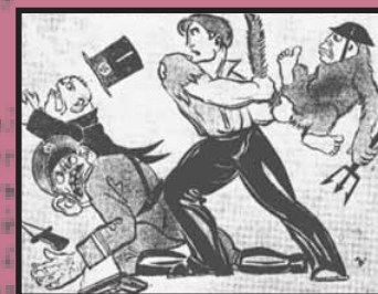
Τους φασίστες δεν τους είχαν σε εκτίμησι: Περιγραφή της επιδρομής στον Ριζοσπάστη 18/11/1934. Τα συνοδευτικά κείμενα ήταν ανάλογου ύφους.