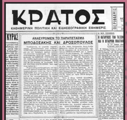
Δίπλα στο παραπέτασμα που ανασκόνεται και αποκάλυπτε τον Μποδοσάκη, έτερον αξιόλογο άρθρον με τίτλο "Η κατάργοις των τάξεων και η πιλερική πολιτική", 3/11/1934.