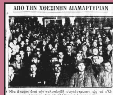
Η συγκέντρωση των εθνικά ευαίσθητων για το θέμα της "Βορείου Ηπείρου", 15/11/1934.