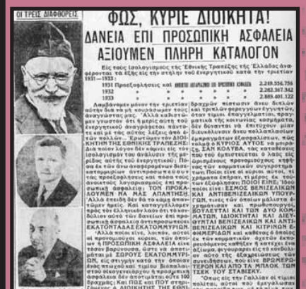
Οι "τρεις διαφθορες της χώρας". Στη μέση μια σπάνια φωτογραφία του διοικητή της Εθνικής τράπεζας που απέφυγε επιμελώς τη δημοσιότητα. Κράτος 25/10/1934.