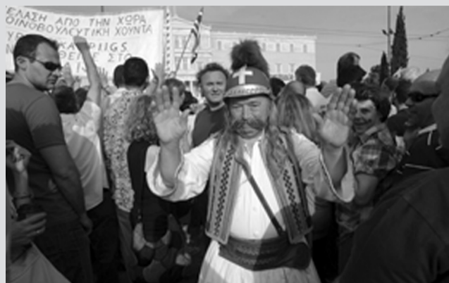
Ακόμα και ο Κολοκοτρώνης σηκώθηκε απ’ τον τάφο για να ευλογήσει τους αγανακτισμένους στο Σύνταγμα

Η “αριστερή παρένθεση” (τρομάρα της) φαίνεται πως εκπαιδείται ταχέως στο σημαντικό έργο της ρύθμισης αναλογιών νόμιμου και παράνομου εργατικού