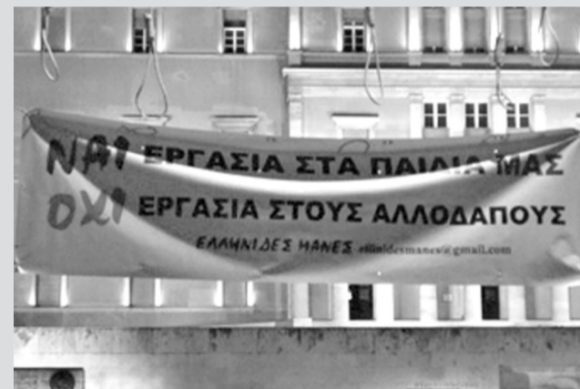
16 Ιουλίου 2011 : Διαχρονική αξία η αγανακτισμένη ελληνίδα φασιστομάνα