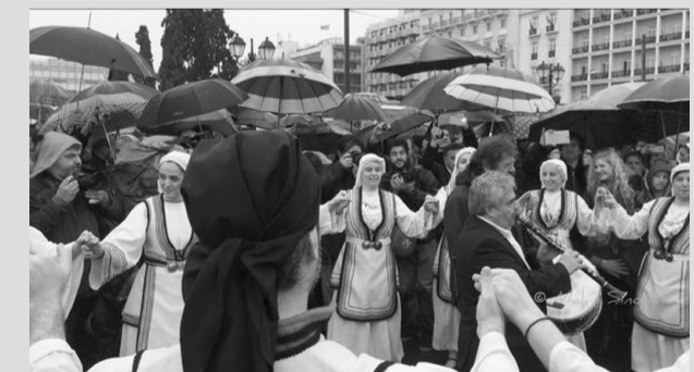
Σύνταγμα, 25/3/2015: Τα κλαρίνα και οι καραγκούνες της εθνικής ενότητας δεν πποούνται απ’ τη βροχή