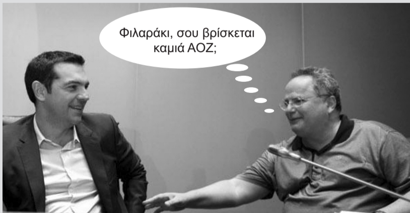
Ο Ν. Κοτζιάς έχει αναλάβει να συνεχίσει την πολιτική περί ΑΟΖ, μια πολιτική που στην ουσία σημαίνει σύγκρουση με την Τουρκία, μια πολιτική που ακολουθεί αταλάντευτα το ελληνικό κράτος από το 2009 και μετά.

Για “άμεσα” αυτό δεν το κόβουμε, αλλά για να κατανοήσουμε την καθυστέρηση ίσως πρέπει να λάβουμε υπόψη μας και τη δήλωση του Γ. Καββαθά, προέδρου της ΓΣΕΒΕΕ κατά τη συνάντησή του με τον Σκουρλέτη στις 12/2: “Αν καθοριστεί νομοθετικά και άμεσα ο κατώτατος μισθός στα 751 ευρώ, το κόστος για τις μικρομεσαίες επιχειρήσεις θα είναι 660 εκατομμύρια ευρώ σε ετήσια βάση και ως εκ τούτου οι μικρομεσαίες επιχειρήσεις που βρίσκονται ήδη σε διεινή θέση, λόγω της κρίσης και πολλές αδυνατούν να καταβάλουν τους μισθούς για 1-6 μήνες, θα βρεθούν σε