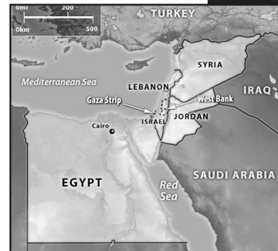
Χάρτης 1: Κράτα τους φίλους σου κοντά και τους εχθρούς σου κοντύτερα: Η στριμωγμένη και προσοδοφόρα θέση του Ισραήλ

ΠΕΡΙΠΤΕΡΟ ( μακροσκελές ίσα πόψεις μικρούλες φωτό )