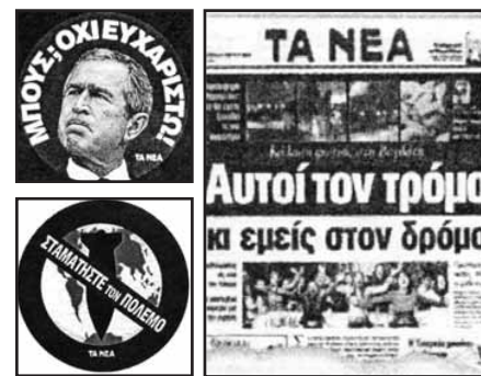
Πρωτοεξέλιδο και αυτοκόλλητα που κυκλοφόρησαν μαζί με την εφημερίδα "Τα Νέα" του συγκροτήματος Λαμπράκη, 31/3/2003.

Ήταν Μάρτιος του 2003 και σύσσωμοι οι Έλληνες καταδίκαν τον "πόλεμο του Μπους". Τότε η βάση της Σούδας θα μπορούσε να βρίσκεται σε άλλο πλανήτη. Το περιοδικό "Φλίπερ" που εκδιδόταν τότε με την ευθύνη της αυτόνομης πολιτικής ομάδας Carthago έκλεινε το κείμενο σχετικά με τον αντιπολεμικό πυρετό που συγκλόνισε την Ελλάδα ως εξής: