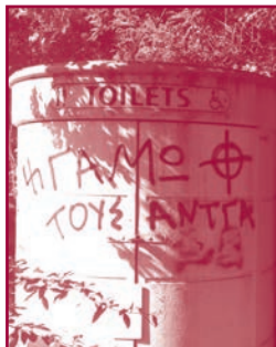
(1) & (2): «γαμώ τους ΑΝΤΤΑ» και «ελλάς κύπρος ένωσης»