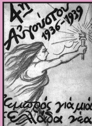
Φολκλόρ, εθνική ανάταση και πρόταγμα: “για μια Ελλάδα νέα”...