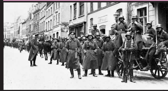
Μάρτις του 1920. Γερμανοί, μέλη των Freikorps με πλήρη εξάρτηση και στο φως της μέρας. Δεν έχουν κάτι να κρύψουν. Συμμετέχουν στον ακήρυχτο ταξικό πόλεμο χρόνια πριν ο φύρερ πάρει την εξουσία.

Ο κύριος επιστήμονας μοιάζει να μην έχει ακούσει τίποτα περί “συνέχειας των ελίτ” και γι’ αυτό πελαγοδρομεί αναζητώντας “δομικές αλλαγές” σε λάθος σημεία. Γι’ αυτό και δεν θα μπορούσε παρά να τον ξενίζει το προφανές· ότι δηλαδή κάποιος μπορεί να είναι και φασίστας και ρεαλιστής (με την έννοια ότι δεν θα ενεργούσε ποτέ εις βάρος των “εθνικών συμφερόντων” και δεν είχε κανένα λόγο να ναρκοθετήσει την μακροχρόνια και