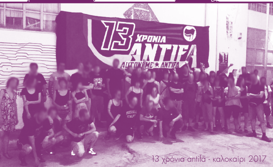
13 χρόνια antifa - καλοκαίρι 2017

I don't care, got no flair For patriotic moments Make my day, I won't pray And will defy salvation I don't care I'm gone - watch my back I don't care The crowd is proud You can count me out Burn the flag, hate this crap Don't want no god or nation Make my day, I won't pray And will defy salvation ... I won't belong, just count me out!