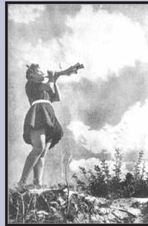
Η ΓΥΝΑΙΚΑ ΕΙΝΑΙ Ο ΠΡΑΓΜΑΤΙΚΟΣ ΑΡΧΗΓΟΣ ΤΗΣ ΟΙΚΟΓΕΝΕΙΑΣ Η ΓΥΝΑΙΚΑ ΘΑ ΔΙΑΦΥΛΑΞΕΙ ΤΗΝ ΠΑΡΑΔΟΣΙΝ