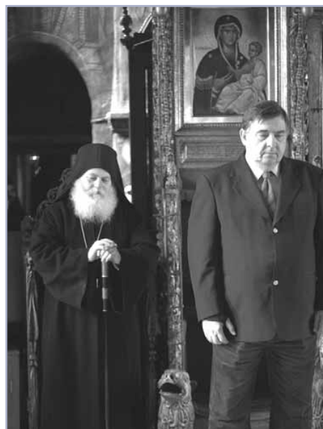
Μονή Βατοπεδίου, Μάρτιος 2011: προσκύνημα στον Εφραίμ. Το βαθύ θείο παρακράτος με την πολιτική του εκπροσώπηση

Λίγες μέρες μετά τη διαγραφή του Καρατζαφέρη από τη Νέα Δημοκρατία τον Μάιο του 2000 -διαγραφή βέβαια που ήδη για τον Καρατζαφέρη ήταν αναμενόμενη, μιας και με τη θεία πνοή να του δίνει αέρα στα πανιά δήλωνε πως δεν σκόπευε να ακολουθήσει τη ΝΔ στην πολιτική του μεσαίου χώρου- ανακύπτει το ζήτημα των ταυτοτήτων. Η απόφαση του Προέδρου της Αρχής Προστασίας Προσωπικών Δεδομένων ότι πρέπει να απαλειφθεί η αναγραφή του θρησκευματος στις ταυτότητες κινητοποιεί όλο το παπαδαριό και μαζί του ξεκύνονται στους δρόμους χιλιάδες ελληνορθόδοξοι σε δύο συλλαλητήρια που γίνονται στην Αθήνα και τη Θεσσαλονίκη το καλοκαίρι του 2000. Ο Καρατζαφέρης αρχίζει να δίνει από τη σχετικά νέα εβδο-