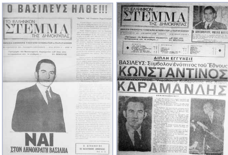
Η εφημερίδα Το Στέμμα της Δημοκρατίας : το βάπτισμα πυρός για τον Καρτζαφέρη