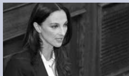
η κόρη όμως... πήγε πιο μπροστά

Η Έλενα Κουντουρά βουλευτής της Ν.Δ. από το 2004 έως το 2007 και πρόσφατα ξανά βουλευτής στη θέση του Δ. Αβραμόπουλου, ξεκίνησε την καριέρα της στη μόδα μέχρις ότου καταλήξει στα έδρανα της Βουλής. Φαίνεται πως στην πολιτική της καριέρα καθοριστικό ρόλο δεν έπαιξε η ομορφιά της όσο το οικογενειακό της δέντρο. Αυτό που είναι λιγότερο γνωστό και δεν προβάλλεται στο βιογραφικό της, είναι ότι ο πατέρας της, ο Αλέξανδρος Κουντουράς, υπήρξε πρόεδρος της Βασιλικής Εθνικής Παράταξης (μετέπειτα Βασιλικής Εθνικής Οργάνωσης), της πιο ισχυρής φιλοβασιλικής οργάνωσης την περίοδο της μεταπολίτευσης, με παραρτήματα στην Αθήνα και την επαρχία και τμήμα νεολαίας. Ο κύριος Κουντουράς δεν είναι τυχαίος. Πρώην υπολοχαγός της ΑΣΔΕΝ (Ανώτατη Στρατιωτική Διοίκηση Εσωτερικού και Νήσων), συνέθεσε επί χούντας μαζί με τον Γεώργιο Καρυδάκη το εμβληματικό “21η Απριλίου-Ελλάς-Ελλήνων-Χριστιανών”. Στο φύλλο του Ελληνικού Στέμματος που εξέδιδε ο Καρτζαφέρης δημοσιεύτηκε και η ακόλουθη πρόσκληση της ΒΕΠ: “Η Βασιλική Εθνική Παράταξη ουδεμία σχέση έχει με οιονδήποτε πολιτικό πρόσωπο ή κόμμα. Δέχεται εις τους κόλπους της όλους τους Έλληνας ανεξαρτήτως κομματικής τοποθέτησεως. Γραφεία: Σολωμού 61 - 2ος όροφος” 6 . Για την ιστορία (οι παλιότεροι θα το θυμούνται) στα ίδια γραφεία στεγάστηκε αργότερα και η Χρυσή Αυγή.