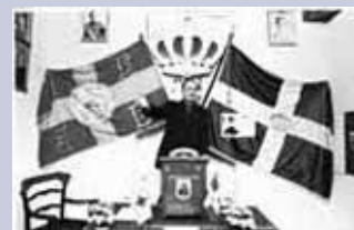
ο μπαμπάς Κουντουράς σε βάθρο ολίγον τι γραφικό...