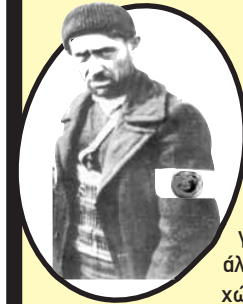
Γαλανόμαυρο στο δίκτυο

Έτσι συμβαίνει λοιπόν και οι γνώμες που υποστηρίζουμε σε αυτή τη σειρά κειμένων μένουν τόσο μόνες τους. Δεν είναι ότι δεν τις έχει σκεφτεί κανείς πριν από εμάς. Είναι ότι κάθε ιστορική αφήγηση προορίζεται για σημερινή χρήση. Πρέπει να στεναχωριόμαστε;