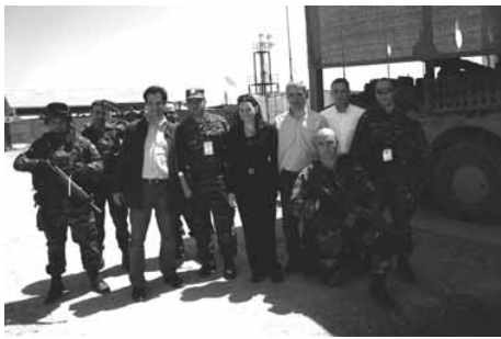
Γορίλες με όπλα και σκουλήκια με πουκάμισα σε κλίμα εύχαρο. Οι εικονιζόμενοι είναι απ' αυτούς που μάχονται για την ειρήνη στο Αφγανιστάν...