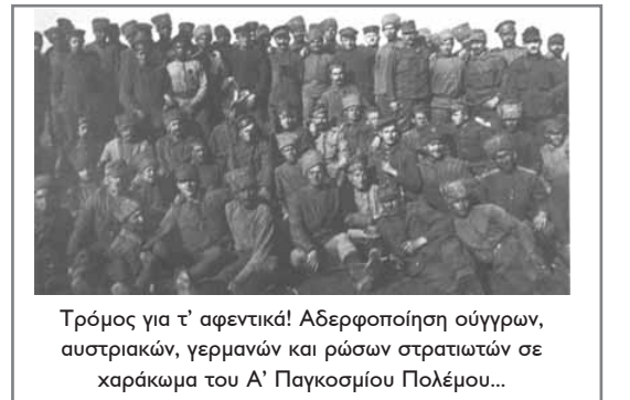
Τρόμος για τ’ αφεντικά! Αδερφοποίηση σύγγρων, αυστριακών, γερμανών και ρώσων στρατιωτών σε χαρακώματα του Α’ Παγκοσμίου Πολέμου...

Πράγματι, η οργάνωση αυτής της τεράστιας επιχείρησης που ονομάστηκε Β’ Παγκόσμιος Πόλεμος σχεδιάστηκε σε μεγάλο βαθμό από ειδικούς. Τρεις ήταν οι μεγάλες σχετικές καινοτομίες. Η πρώτη είχε να κάνει με την ιδέα της μηχανικής μεσολάβησης και την αυτοματοποίηση του θανάτου. Παρά τον ασύληπτο έως τότε αριθμό θυμάτων του Α’ Παγκοσμίου Πολέμου, οι ειδικοί