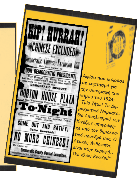
Αφίσα που καλούσε σε εορτασμό για την υπογραφή του νόμου του 1924: “Τρία ζητώ! Το Δημοκρατικό Νομοσχέδιο Αποκλεισμού των Κινέζων υπογράφκε από τον δημοκρατικό πρόεδρό μας. Ο Λευκός Άνθρωπος είναι στην κορυφή... Όχι άλλοι Κινέζοι!”