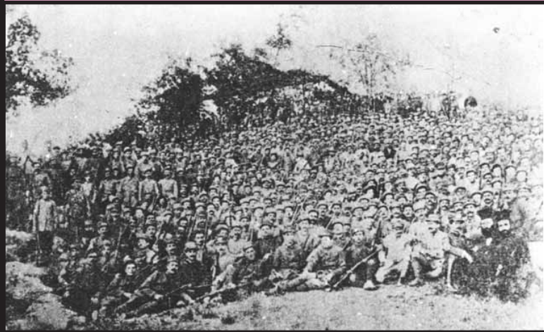
“Βόρειος Ήπειρος”, 1914

Ο “ιερός λόχος Κορυτσάς” κάπου την Άνοιξη του 1914. Όταν ο ελληνικός στρατός αναγκάστηκε, λόγω πιέσεων των (σύμμαχων τότε) Ιταλών, να αποχωρήσει από την “Βόρειο Ήπειρο” κατά τη διάρκεια του Α΄ Παγκοσμίου Πολέμου, αμέσως αντικαταστάθηκε από “ένοπλα τμήματα αυτονομιακών” (ίσως το “μεταμφιέστηκε σε” να είναι κοντύτερα στην πραγματικότητα). Το σχέδιο ήταν να επιδιωχθεί πρώτα η αυτονόμηση της “Βορείου Ηπείρου” και έπειτα η προσάρτησή της στο ελληνικό κράτος. Οι παπάδες κάτω δεξιά είναι για ηθική υποστήριξη.