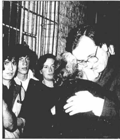
Χαράμη στην αγορά των Ελλήνων επιστημόνων Εξωτερικών κ. Α. Σαμαρά η γυναίκα Βορειοηπειρώτισσα, εκδηλώνει μ' αυτόν το συγγεντικό τρόπο τους μέγιστους πόθους των συμπατριωτών που ζουν στην Αλβανία.

Δείγμα της προβολής που έτυχε ο γαλανόμαυρος ηγέτης μας και η επίσκεψή του στον αλβανικό νότο τον Οκτώβρη του 1990. Η φωτό με τον Σαμαρά είναι από το στυλοβάτη του ένθετου, την “Καθημερινή” (28/10/1990). Οι “μύχιοι πόθοι” των βορειοηπειρωτών και ο εκφραστής τους σε “τροφερό” ενσταντανέ.