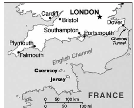
Χάρτης 3: Τα νησιά της Μάγχης: Λάθος θέση mate

Τα αγγλικά νησιά Guernsey και Jersey. Ζήτησαν πλήρη υφαλοκρηπίδα. Εισέπραξαν "είστε γεωγραφικά αποκομμένοι" και άλλες βρισιές στα διπλωματικά.