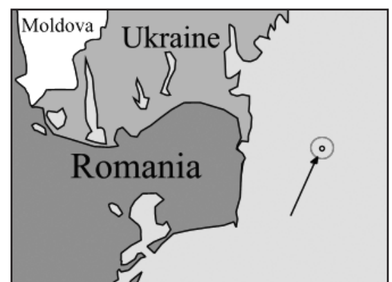
Χάρτης 4: Σβήστε μας απ' το χάρτη σας!

Το ουκρανικό Φιδονήσι. Ζήτηγε προσοχή, του είπαν ότι είναι "σα να μην υπάρχει στο χάρτη". Βανδαλούη φάση.