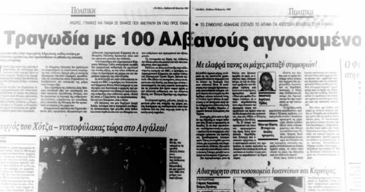
Κάποιοι άλλοι πάντως δεν περνάνε διόλου καλά. Χιλιάδες Αλβανοί προσπαθούσαν να φύγουν από τη χώρα και σε αντάλλαγμα η Ιταλία βύθισε ένα πλοίο με μετανάστες ενώ η Ελλάδα ξανάνοιξε τα στρατόπεδα συγκέντρωσης. (αριστερά Εξουσία 10/4/1997, δεξιά Τα Νέα 29/3/1997)

Χθες υπήρξαν και ορισμένες διαμαρτυρίες γονέων σε μερίδα ηλεκτρονικών μέσων μαζικής ενημέρωσης για περιπτώσεις ΕΠΥ (Εθελοντές Πενταετούς Υποχρέωσης) που έχουν επιλεγεί να σταλούν στην Αλβανία, χωρίς να έχουν προσφερθεί εθελοντικά.