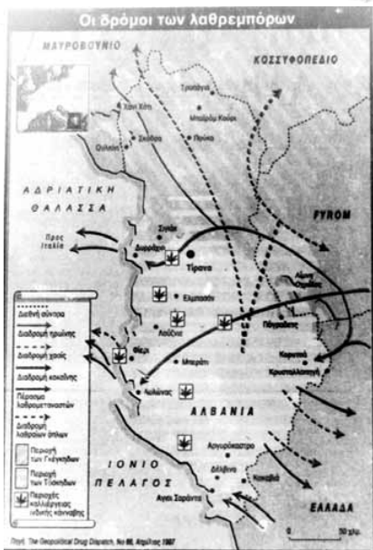
Χάρτης της Αλβανίας όχι με στρατιωτικά αλλά με φουντάδια. Ο Τάσος Τέλλογλου μας πληροφορεί για το ναρκωτικό στα ελληνοαλβανικά σύνορα και πώς η ελληνική αστυνομία το διευκολύνει. (Καθημερινή, 26/4/1997)

Τα καθήκοντα συνεπώς της ΕΛΔΑΛ σε όλη τη διάρκεια της επιχείρησης ALBA (έως τον Αύγουστο του 1997) ήταν οι αποστολές αναγνώρισης και οι περιπολίες γύρω από τα στρατόπεδα όπου ήταν εγκατεστημένη. Η συνοδεία οχημάτων μη κυβερνητικών οργανώσεων που κουβαλούσαν "ανθρωπιστική βοήθεια" (τροφή και φάρμακα). Η υποστήριξη της διεξαγωγής των εκλογών στις 29/6/1997 μέσα από περιπολίες στις περιοχές ευθύνης της, η μεταφορά επιτηρητών του ΟΑΣΕ από και προς τα εκλογικά κέντρα και η "τήρηση εφεδρειών για επέμβαση σε περίπτωση που χρειαζόταν". Τούτο το τελευταίο σήμαινε πως οι ελληνικές δυνάμεις επιτρεπόταν "έπειτα από αποτυχία άλλων μη βίαιων ενεργειών να χρησιμοποιήσουν βία σε περίπτωση που πολίτες εμπόδιζαν την κίνηση των φίλιων δυνάμεων με διαδηλώσεις, εξεγέρσεις ή άλλα μέσα" 17 .