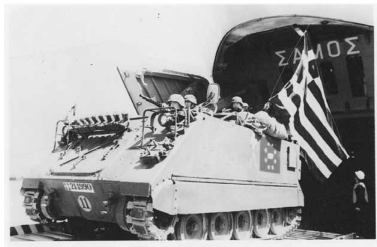
Μέσα προς τέλη Απριλίου 1997. Αποβίβαση στο Δυρράχιο του ελληνικού στρατού.

Χάρτης της Αλβανίας με τις περιοχές όπου εγκαταστάθηκαν τα στρατά της επιχείρησης ALBA. Η ελληνική πολιτική ηγεσία ήθελε περισσότερες ελληνικές σημαϊούλες προς το νότο. Δεν τα πήγε πάντως άσχημα.