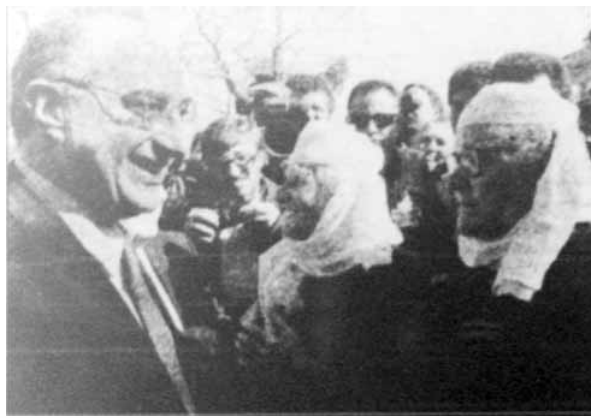
Αριστερά, εποχές που ο Τσοκατζόπουλος ήταν εθνικά χρήσιμος. Η προοπτική της εγκατάστασης Ελλήνων στρατιωτών στον αλβανικό νότο γεμίζει χαρά τον ελληνικό τύπο (Εξουσία 10/4/1997). Δεξιά ο υφυπεξ Γιάννος Κρανιδιώτης σε επίσκεψή του στο Αργυρόκαστρο στα μέσα Μαρτίου 1997 σε στυλ "μην ανησυχείτε, ερχόμαστε" (Τα Νέα 19/3/1997).