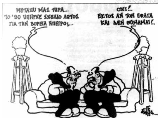
Ο Σημίτης αριστερά ρωτά τον Μητσοτάκη αν όντως στις αρχές των 90's θέλανε να φάνε τη "Βόρεια Ήπειρο" σύμφωνα με το σχέδιο Λωτός για το οποίο μίλησε στο αλβανικό κοινοβούλιο ο τέως αρχηγός των αλβανικών μυστικών υπηρεσιών, παραμονές της επιχείρησης ALBA. Κάπως καρφωματικό για τους Έλληνες το σκίτσο, δεν νομίζετε; (Τα Νέα 28/3/1997)

(...) Οι αλλαγές στη σύνθεση αυτών των ομάδων δίωξης, που υπάρχουν στη μεθόρι, είναι συνεχείς, τα δικαστήρια απρόθυμα να ρισκάρουν συγκρούσεις με έξωθεν παρεμβάσεις και ο Τύπος ιδιαίτερα ευαίσθητος στα ατομικά δικαιώματα των λαθρεμπόρων. Και οι τοπικές κοινωνίες δεν ενθαρρύνουν τους