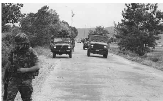
Ο ελληνικός στρατός περιπολεί στις αλβανικές περιοχές ευθύνης του με "ανθρωπιστικές" διαθέσεις.

Αριστερά, αλβανικό συγκρότημα που έχει κληθεί για να διασκεδάσει τους έλληνες στρατιώτες στην Αλβανία. Δεξιά, η γνώριμη greek orthodox φάση. Η έναρξη της ALBA συνέπεσε με το Πάσχα και ο έλληνας πρέσβης στην Αλβανία ψήνει αρνιά με "τα παιδιά μας που είναι μακριά από τις οικογένειές τους". Τα κακόμοιρα, τι τραβάνε....