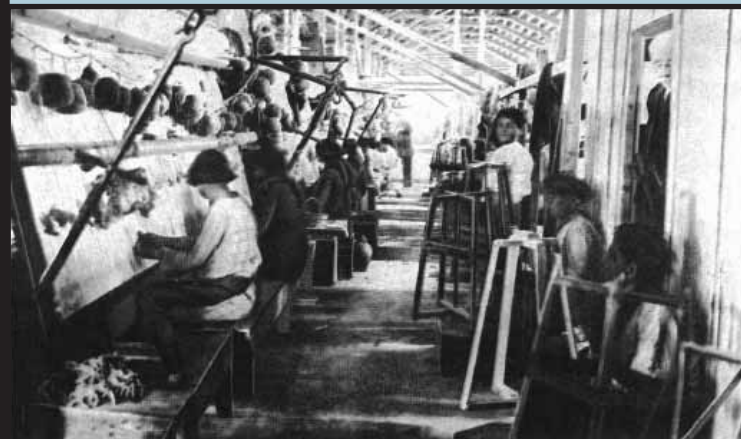
Εργάτριες σε εργοστάσιο ταππητουργίας στην Αθήνα του Μεσοπολέμου. Το μάτι του επόπτη караδοκεί σαν το κοράκι, για να αρπάξει στον αέρα τους νεκρούς χρόνους.