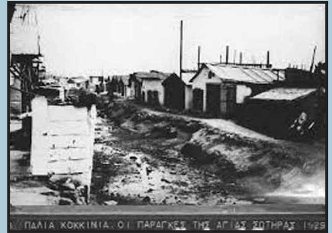
Παράγκες στη Νίκαια, το 1929. Μπορούμε να φανταστούμε την απόκοσμη αποφορά που έβγαινε από το “ποτάμι” που βρίσκεται κατά μήκος της φωτογραφίας. Ή μάλλον, τώρα που το ξανασκεφτόμαστε, μάλλον δεν μπορούμε...

Ας μην ξεχνάμε ότι εκείνες τις εποχές υπήρχε ακόμα η πιθανότητα να κάνει η κρίση “τους φτωχούς, κομμουνιστές”. Κάτι που μπορούσαν να καταλάβουν ακόμα και εκείνοι οι συντηρητικοί και καλοζωισμένοι Μικρασιάτες που είχαν αναλάβει να πειθαρχούν, να νουθετούν και να εξημερώνουν τους εργάτες. Ορίστε ένα απόσπασμα από το κύριο άρθρο της εφημερίδας Προσφυγικός Κόσμος, με τίτλο “ Το κράτος με την αναληγσίαν του μας οδηγεί βία προς τα αριστερά ”: