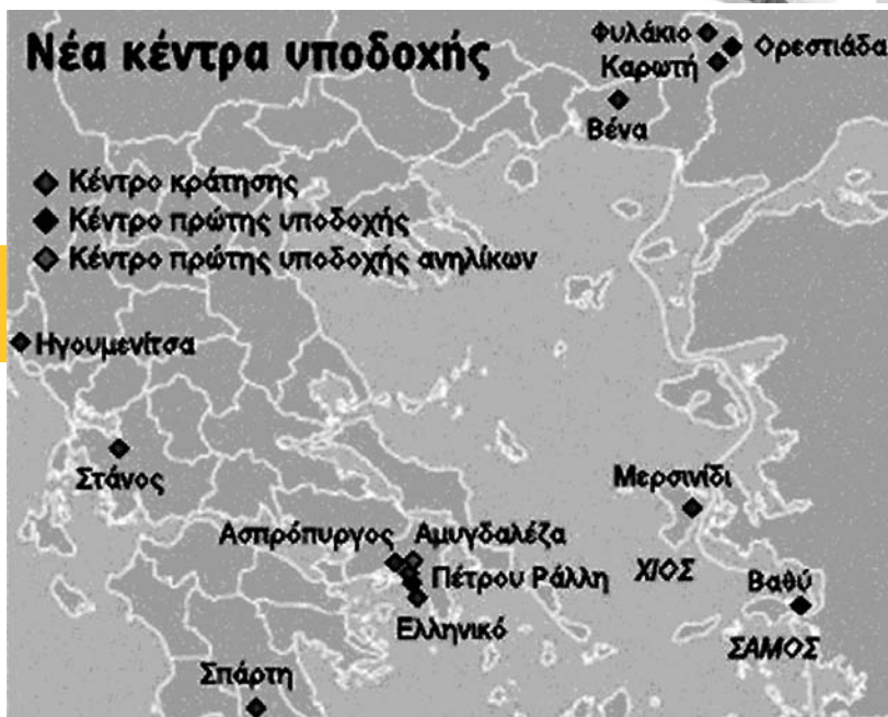
Χάρτης του ελλαδικού χώρου συνοδεύει τις ανακοινώσεις για νέα στρατόπεδα συγκέντρωσης με διαφορετικές ονομασίες που δεν διαφοροποιούν καθόλου τη λειτουργία τους.

στορικό και η εν γένει κατάσταση τους, θα τους παρέχονται οι πρώτες υπηρεσίες υποδοχής, θα διαπιστώνονται οι ιδιαίτερες ανάγκες και το νομικό τους καθεστώς και, ανάλογα με τα στοιχεία που θα συλλέγονται, θα αποφασίζεται και η περαιτέρω μεταχείρισή τους από την πολιτεία”.