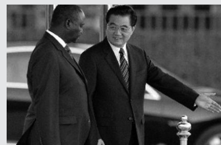
Ο Πρόεδρος της Κεντροαφρικανικής Δημοκρατίας Francois Bozize συναντά τον πρόεδρο της Κίνας, Hu Jintao στο Πεκίνο, 10.09 2009. Κάτι τέτοια βλέπανε οι Γάλλοι και του την κάνανε την δουλειά...

Όταν μια περιοχή σαν την Sahara Sahel, αρκετά μεγάλη για να πιάνει κάμποσες χώρες, μετατρέπεται από τα «τυφλά κτυπήματα» και το ναρκωμπόριο σε καμένη γη, είναι ενδιαφέρον να δούμε τον αντίκτυπο που έχει το γεγονός αυτό σε τομείς της τοπικής οικονομίας όπως ο τουρισμός. Την Μαυριτανία για παράδειγμα, το 2007 την επισκέφθηκαν 72.500 τουρίστες. Τέσσερα χρόνια μετά, το 2011, την είχαν επισκεφθεί 173. Οι απαγωγές τουριστών και οι «τρομοκρατικές» επιθέσεις ήταν κάπως καταλυτικές για την περιοχή... Μία τέτοια συρρίκνωση του τουρισμού σε τέσσερα μόλις χρόνια είναι αναπόφευκτο να αφήσει τα σημάδια της στην τοπική κοινωνία. Πού θα δουλέψουν όλοι αυτοί που έβρισκαν δουλειά μέχρι πρότινος στον τουρισμό; Η απάντηση είναι πολύ απλή: μα στα ναρκω-δίκτυα φυσικά, το κομμάτι της οικονομίας που ανθίζει!