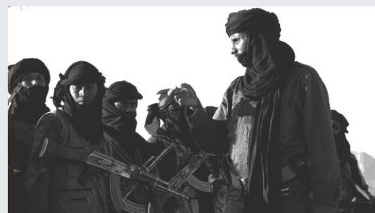
Τουαρέγκ αληθινοί, όχι Λώρενς φάση.

Ιανουάριος 2010: «Το Πεκίνο βάζει τα δυνατά του όσον αφορά τις στρατιωτικές συνεργασίες του, την διπλωματία και τις προσπάθειες ανάπτυξης». Το γράμμα επίσης επισημαίνει πως στην αμερικανική πρεσβεία δουλεύουν 4 διπλωμάτες-πράκτορες που μένουν μόνιμα στην πρωτεύουσα της ΚΑΔ, ενώ η κινεζική πρεσβεία έχει 40 υπαλλήλους. Επίσης, κάθε χρόνο 40 αξιωματικοί του στρατού της ΚΑΔ εκπαιδεύονται στην Κίνα, ενώ μόνο 2-3 εκπαιδεύονται στις ΗΠΑ και 10-15 στην Γαλλία. Και συνεχίζει, «Με τις γαλλικές επενδύσεις περιορισμένες και την γαλλική επιρροή γενικά σε πώση, οι κινέζοι παρουσιάζονται ως οι κύριοι ευεργέτες της ΚΑΔ με αντάλλαγμα την πρόσβαση στα κοιτάσματα ουρανίου, χρυσού, σιδήρου, διαμαντιών, και πιθανά πετρελαίου».