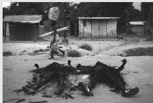
Καθημερινότητα στην Κεντροαφρικανική Δημοκρατία. Καμένα πτώματα στον δρόμο για την λαϊκή.