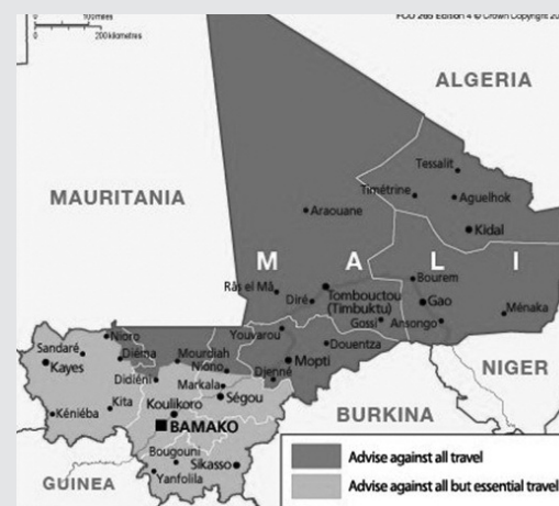
Χάρτης του Μάλι. Το βόρειο κομμάτι, το Azawad, είναι με κόκκινο. Το νότιο με κίτρινο. Από κάτω η λεζάντα γράφει: (κόκκινο) συνιστάται η μη διάσχιση για κανένα λόγο, (κίτρινο) συνιστάται η διάσχιση μόνο εάν είναι απαραίτητο.