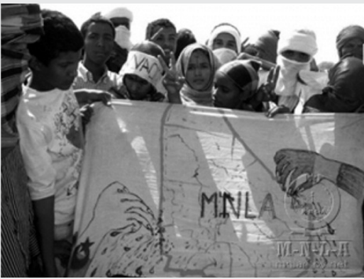
Παιδιά κρατάνε χάρτη του Azawad με τα αρχικά των Τουαρέγκ. Το αριστερό και το δεξί χέρι με τα νύχια που επιτίθενται στο Azawad έχουν ζωγραφισμένη την σημαία της Αλγερίας και του Μάλι αντίστοιχα.