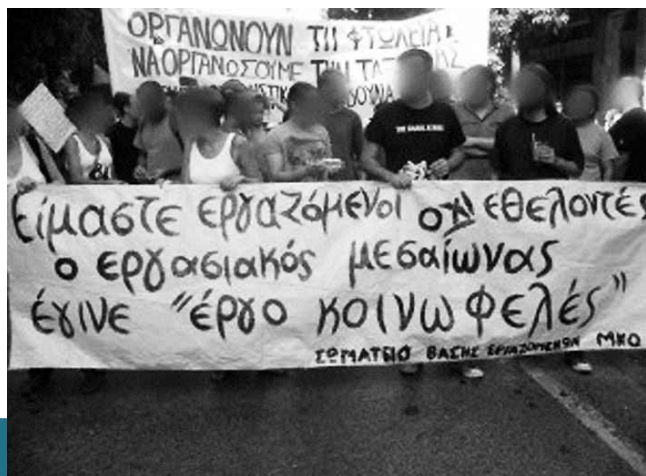
Χίλια δίκια, αλλά το κακό είναι ότι εάν περνάς τις μισές μέρες σου λέγοντας και πιστεύοντας ότι είσαι εργαζόμενος και τις άλλες μισές ότι επιτελείς κοινωνικό έργο, στο τέλος θα σχιζοφρενιάσεις και εσύ και αυτοί που σε ακούνε...

Θα το πούμε κι ας πέσει χάμω. Θέλει πολλή προσπάθεια για να μην γίνεσαι καχύποπτος μπροστά στον συνδυασμό των όρων «Μετανάστευση» και «Ανάπτυξη» και η περιγραφή που συνεχίζει δεν βοηθά καθόλου προς αυτή την κατεύθυνση. Ειδικά όταν ένας από τους πρωταρχικούς της στόχους είναι «η ανάπτυξη δικτύου παροχής υπηρεσιών κατάρτισης, λειτουργίας και διαχείρισης ανοικτών και κλειστών κέντρων υποδοχής αλλοδαπών και στήριξης των τοπικών φορέων στα σημεία εισόδου αλλοδαπών».