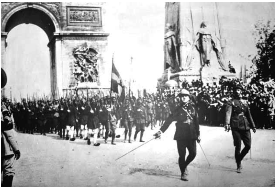
1918, Παρίσι. Ο ελληνικός στρατός παρελαύνει μαζί με τον βρετανικό και τον γαλλικό κι όλοι μαζί γιορτάζουν τη νίκη στον Α' Παγκόσμιο Πόλεμο. Σαν να λέμε, το ότι τα συμφέροντα του ελληνικού κράτους βρίσκονταν στην πλευρά της Αγγλίας και της Γαλλίας ήταν κάτι που αποφασίστηκε όχι στον Β' αλλά στον Α' Παγκόσμιο Πόλεμο...

προθύμως συγκατετέθη να βοηθήσει τους Συμμάχους εις τον εν Ρωσία αγώνα αυτών ίνα δυνηθή να κάμψη τας προβαλλομένας αντιδράσεις” 5 .