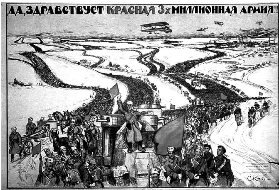
Προπαγανδιστική αφίσα των μπολσεβίκων. Με κάτι τέτοια θα πήραν αέρα τα μυαλά των γάλλων ναυτών και στασιασών. Πού να ήξεραν όμως ότι τους περίμενε στη γωνία ο ελληνικός στρατός;

περισσότεροι από 200. Στο Ναύπλιο, καταδικάστηκαν ένας λοχίας κι έξι στρατιώτες για λιποταξία, στην Κοζάνη έκτακτο στρατοδικείο καταδίκασε σε θάνατο δεκαεννέα και στρατιώτες, ενώ στις 26 Γενάρη στασίασε στη Θήβα το 2 ο Σύνταγμα Πεζικού. Μάλιστα, η κυβέρνηση Βενιζέλου, για να διαλύσει τους στασιαστές, χρησιμοποίησε το πυροβολικό και στη συνέχεια διέταξε να γίνουν συλλήψεις κι εκτελέσεις στρατιωτών 9 . Ο λόγος στον τότε υπουργό Δικαιοσύνης, Ιωάννη Τσιριμώκο: