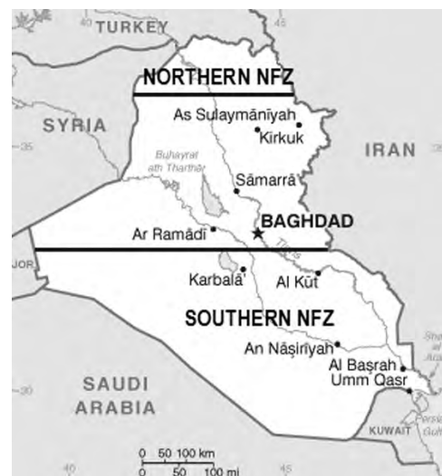
Η τριχοτόμηση του Ιρακ τότε που ήταν ιπτάμενη

Η βόρεια «Ζώνη Απαγόρευσης Πτήσεων» πάνω από το Ιράκ, δημιουργήθηκε και συντηρήθηκε με αμερικανικά χρήματα από το 1991 έως το 2003. Χρησίμευσε ώστε να συγκεντρωθεί ο κουρδικός πληθυσμός εκεί που χρειαζόταν για τη δημιουργία του «ιρακινού Κουρδιστάν». Εν τω μεταξύ οι Έλληνες τραγουδούσαν το «η Ειρήνη στο Αιγαίο περνάει από τα βουνά του Κουρδιστάν» και ήταν όλοι πολύ ικανοποιημένοι. Στον ίδιο χάρτη μπορεί να δει κανείς πόσες κουρδικές ζώνες άμεσης δημοκρατίας έχει η Τουρκία στα νοτιο σύνορά της και να φανταστεί πόσο λατρεύει το τουρκικό κράτος την προοπτική της αμεσοδημοκρατικής κυκλοφορίας ενόπλων προς (και κυρίως από) τη Συρία.