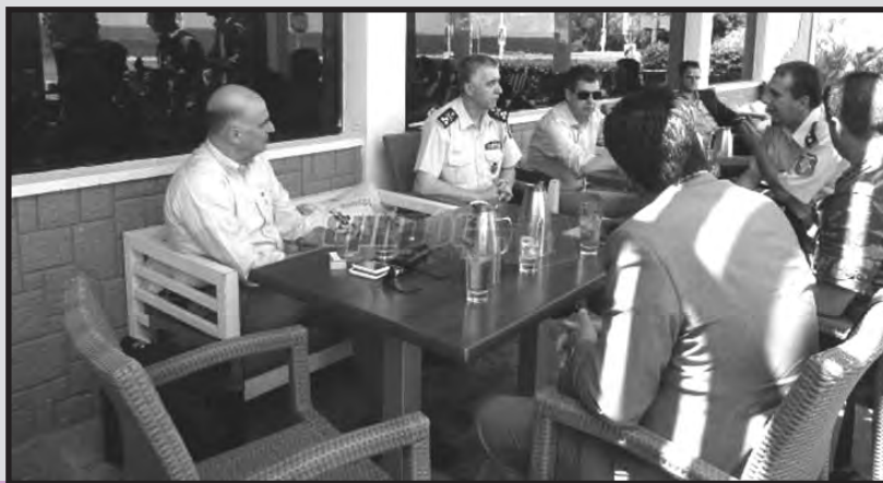
Ο τότε υπουργός της αστυνομίας Δένδιας στη Μυτιλήνη, το καλοκαίρι του 2013. Αφού ξεμπερδέψε με τους “χώρους ανομίας”, προχωρά στην ανέγερση “χώρων νομιμότητας”.

Μπορούμε να δούμε εμφανώς φουσκωμένα ποσά, όπως τα χιλιάδες ευρώ για τη μεταφορά 3 μεταναστών στην Τουρκία, συναντάμε όμως και ποσά ρουτίνας, όπως για το άδειασμα των βόθρων. Μιας και αναφέρονται, οι δε βόθροι τελικά δεν αδειάζονταν και τα λήμματα ξεχείλιζαν σε κοντινό οικόπεδο. Θα πρέπει να λαμβάνει κανείς υπόψη πως τα συγκεκριμένα ποσά, αν μοιάζουν φουσκωμένα για τις συγκεκριμένες δουλειές, στην πραγματικότητα είναι τσάμπα χρήμα για υπηρεσίες που δεν είναι ανάγκη να παρέχει κάποιος. Οι φυλακισμένοι μετανάστες δεν είναι άλλωστε ο “οποιοσδήποτε πελάτης που έχει πάντα δίκιο”. Έτσι, μονότονα επαναλαμβάνονται τα δημοσιεύματα για ηλεκτρικά, υδραυλικά, στατικά κλπ κλπ προβλήματα.