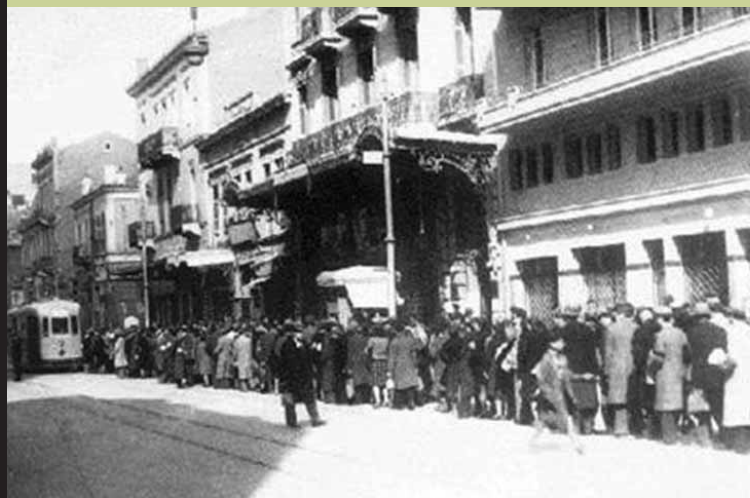
Κλασική φωτογραφία της εποχής. Ατέλειωτες ουρές και αμέτρητες ώρες αναμονής με το δελτίο τροφίμων στο χέρι.