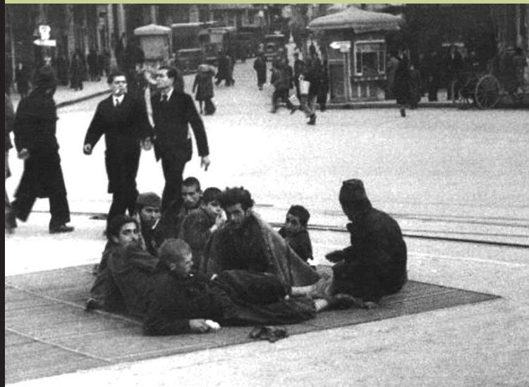
Πλατεία Ομονοίας, χειμώνας '41-'42. Αυτοί που δεν είχαν πρόσβαση σε τίποτα κατέφευγαν στους αεραγωγούς του ΗΣΑΠ για λίγη ζέστη. Πίσω τους, αυτοί που είχαν πρόσβαση σε όλα. Με τα κουστουμάκια τους και τη σιγουριά που τους προσέφερε η γεμάτη τους τσέπη δεν φαίνονται και πολλοί βασανισμένοι από την πείνα...