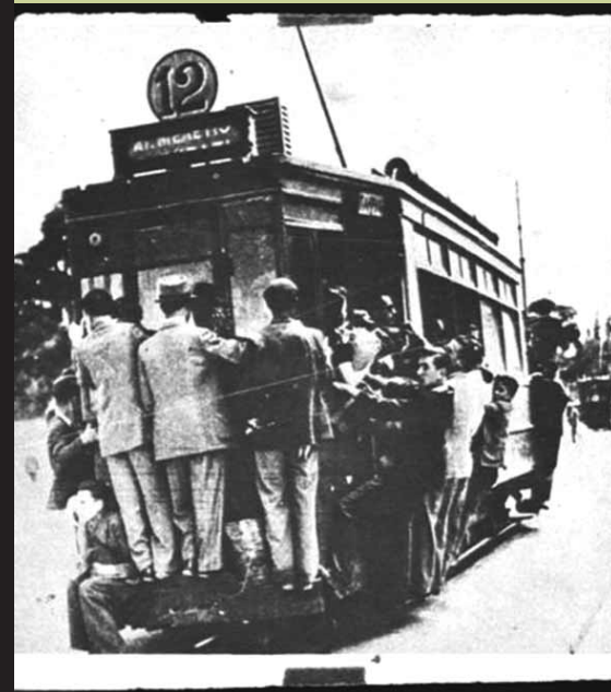
Πιο γεμάτο δεν γίνεται. Κι αν δεν ήσουν νευριασμένος πριν ανέβεις, θα νευρίαζες μέσα στο πρώτο πεντάλεπτο.