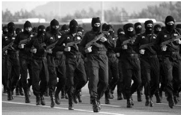
Αντιτρομοκρατική μονάδα των ενόπλων δυνάμεων της Σαουδικής Αραβίας. Οποιαδήποτε ομοιότητα είναι συμπτωματική.

Ανατολικά ελέγχει τον Περσικό κόλπο και δυτικά τον διάπλου από την ερυθρά θάλασσα. Γεωπολιτικά μιλώντας... not bad at all. Κατα τα άλλα, το 2010, και ενώ η τιμή πετρελαίου έπεφτε, η Σαουδική Αραβία παρήγγειλε 84 νέα αεροσκάφη F-15SA και αναβάθμισε τα 70 F-15S που ήδη είχε με κόστος 29,4 δισ. δολάρια. Επιπλέον είναι το μοναδικό κράτος του Περσικού κόλπου που κατέχει αεροπλανοφόρο.