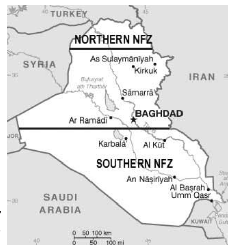
Χάρτης 3: Απαγόρευση πτήσεων πάνω από το Ιράκ, 1991-2003. NFZ σημαίνει «No Flying Zone».