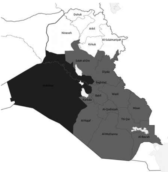
Χάρτης 4: Αποτέλεσμα των ιρακινών εκλογών του Ιανουαρίου του 2005.