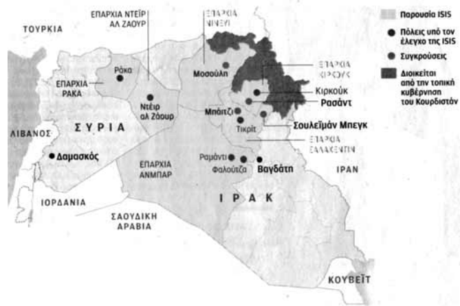
Χάρτης 5: Μετά που άνοιξαν «οι πόρτες του κακού»: Η κατάσταση του Ιράκ στα τέλη του 2014.

τρόπο που όλοι έχουμε συνηθίσει να βλέπουμε τελευταία. Βόρεια οι περιοχές των Κούρδων, νοτιοανατολικά οι περιοχές των Σιιτών, νοτιοδυτικά οι περιοχές των Σουνιτών. Επειδή ξέρουμε ότι αυτός ο χάρτης κάτι σας θυμίζει, βοηθάμε στην επίλυση του de ja vu υπενθυμίζοντας τον χάρτη της διάλυσης του Ιράκ, όπως κυκλοφορεί από το καλοκαίρι του 2014 (Χάρτης 5).