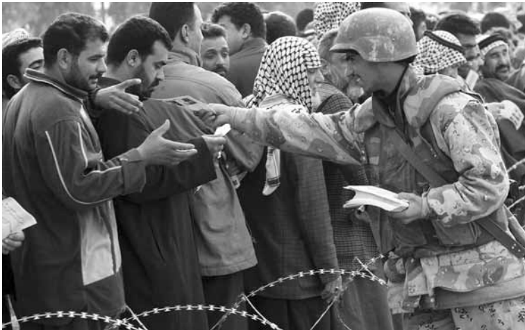
Προεκλογική εκστρατεία στο Ιράκ, Ιανουάριος του 2005.