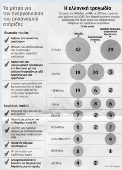
Ανάλυση του ελληνικού χρέους από την Καθημερινή 29/4/2010.

Η σχέση του ελληνικού κράτους με την Ευρωπαϊκή Ένωση από το 2009 και μετά προσδιορίστηκε από την κίνηση κρατικοποίησης του χρέους. Αυτή η κίνηση είχε ένα βαρύ και σαφές νόημα. Το ελληνικό κράτος ανέλαβε για δική του την χρηματική έκφραση της καπιταλιστικής κρίσης της αστικής του τάξης. Είπε «αυτό το χρέος που έως πρότινος οφειλόταν στις τράπεζες και δεν θα πληρωνόταν ποτέ, είναι δικό μου χρέος». Από τη σκοπιά εκείνων που είχαν δανείσει το ελληνικό κράτος, η δήλωση ήταν βαρυσήμαντη. Όπως έχουμε ξαναπεί, η είσπραξη κάθε χρέους συνοδεύεται από ένα υπονοούμενο βίας. 17 Αν ο κακοπληρωτής Μήτσος χρωστάει στον Τάκη, ο Τάκης μπορεί να κάνει μήνυση και να έρθουν οι μπάτσοι, ή να προσλάβει μπράβους. Στην περίπτωση όμως που ο οφειλέτης είναι ένα καπιταλιστικό κράτος, η είσπραξη του χρέους σημαίνει σε τελική ανάλυση ότι αν ο οφειλέτης αποφασίσει να μην πληρώσει, η είσπραξη των χρωστούμενων μπορεί να γίνει μόνο αν καταβληθεί η ένοπλη ισχύς του κράτους οφειλέτη. Εν τω μεταξύ, το χρέος που το ελληνικό κράτος είχε κάνει δικό του, ήταν χρωστούμενο κατά 40% στις ελληνικές τράπεζες και τα ελληνικά ασφαλιστικά ταμεία και κατά 60% σε τράπεζες και οργανισμούς «του εξωτερικού», δηλαδή των επιμέρους ευρωπαϊκών κρατών.