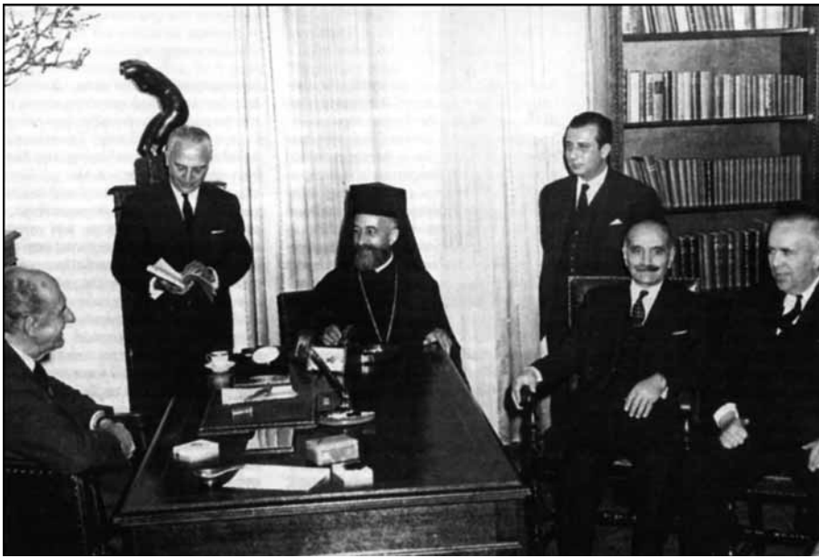
Αθήνα, Μάρτιος 1964. Ο Μακάριος στην πρωθυπουργική κατοικία, στο Καστρί. Τη χαρούμενη παρέα συμπληρώνουν ο πρωθυπουργός της Ελλάδας, Γ. Παπανδρέου, ο Έλληνας υπουργός Εθνικής Αμυνας Πέτρος Γαρουφαλιάς, ο Κύπριος υπουργός Εξωτερικών Σπύρος Κυπριανού, ο Γ. Γρίβας και ο Έλληνας υπουργός Εξωτερικών Σταύρος Κωστόπουλος.

της, για το χτίσιμο του νέου εθνικού κορμού που χώραγε όλους τους καλοθελητές, από «μετανιωμένους» χουντοφασίστες έως «συμφιλιωμένους» αριστερούς.