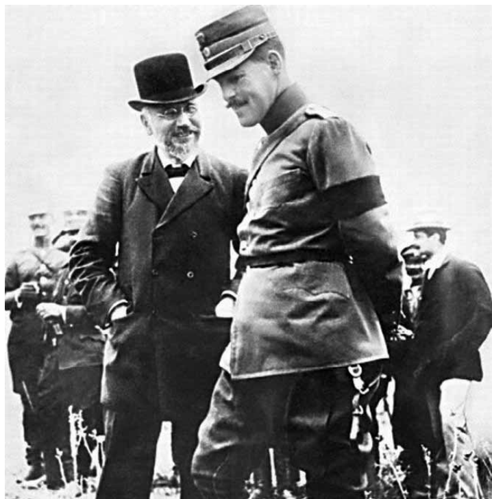
Δεν είναι ο Βελζεβούλης. Είναι ο Βενιζέλος, τότε που δεν είχαν καταλάβει καλά την πολιτική σημασία της φωτογραφίας. Εξ ου και το ύφος.

ψουν την επαφή της με τη Γερμανία. Κατά τα άλλα όμως, ο καθένας ήθελε τα στενά και την Κωνσταντινούπολη για λογαριασμό του. Για τη Ρωσία τα στενά θα ήταν ευλογία: επιτέλους θα έλεγχε την πρόσβασή της στη Μεσόγειο δίχως ενδιάμεσους. Για τη Μεγάλη Βρετανία το ίδιο πράγμα θα ήταν κατάρρα, αυτό ακριβώς που προσπαθούσε να αποφύγει πολεμώντας σε ολόκληρο τον πλανήτη για ολόκληρο τον 19 ο αιώνα.