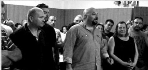
Πάνω: Η χ.α. στο δημαρχείο της Κω. Κάτω: στο χωριό Ζηπάρι με τους ψηφοφόρους κατοίκους της.