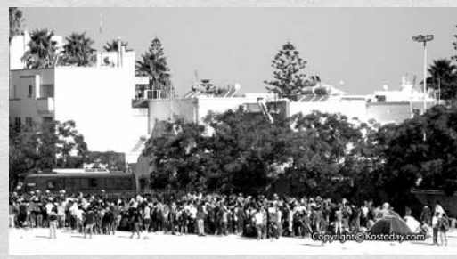
Πάνω: δακρυγόνα στη διαδήλωση των μεταναστών. Κάτω: το γήπεδο Ανταγόρας