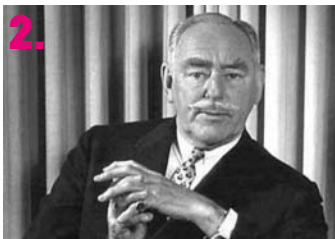
2. Ο πρέσβης των κακών Αμερικάνων, Dean Acheson (φτου του).