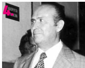
4. Ο χουντικός Ιωαννίδης (φτου του κι αυτουνού).

Η λίστα είναι μακρά και ο εκθεσιακός μας χώρος περιορισμένος. Για εσάς, πάντως, που περιμένετε να φτύσετε και το ελληνικό κράτος... να πούμε ότι θα στεγνώσετε από σάλιο κι ακόμα θα περιμένετε.