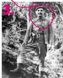
3. Ο αρχιεπίσκοπος Γρίβας (ξανά φτου του).