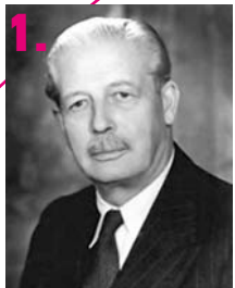
1. Ο Βρετανός πρωθυπουργός Harold Macmillan (φτου του).