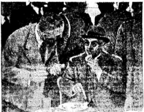
*Ο μεγαλοεπιχειρηματίας κ. Ο. Χέλης συνομιλῶν μετὰ τοῦ Πρωθυπουργοῦ κ. Γεω. Μεταξά.

Για κάποιον καταραμένο λόγο, η φωτογραφία του στρατηγού Μεταξά με τον κύριο Χέλη έχει βγει τόσο θολή που δυσκολευόμαστε ακόμη και να πούμε ποιος είναι ο καθιστός και ποιος ο όρθιος.