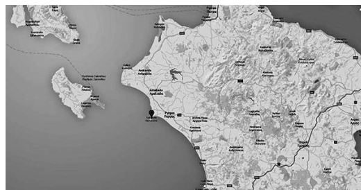
Για όσους δεν ξέρουν πού είναι το Κατάκωλο και ποια η σχέση του με τη Ζάκυνθο και τον Πύργο...

Οι γεωτρήσεις στην «ελληνική Θράκη», παρότι για κάποιο λόγο τέρμα γωνία, συνέχισαν να πηγαίνουν από το καλό στο καλύτερο για κάποιους μήνες, πάντα συνοδευόμενες από την «επίλυση του δημοσιονομικού προβλήματος», την «μάχη μεταξύ τεραστίων συμφερόντων για τον καθορισμό ζωνών επιρροής», την όλο και ενδεικτικότερη οσμή πετρελαίου να αναδύεται από τα ροταριανά τρυπάνια και βεβαίως τη γενναιοδωρή χρηματοδότηση του υποκαταστήματος Αλεξανδρουπόλεως της Εθνικής Τραπέζης. Στις 9 Ιανουαρίου του 1937, το «ενδεχόμενο πικράς απογοητεύσεως» από το κοίτασμα ανατολικά των Φερών είχε πλέον αποκλειστεί επιστημονικώς. Και σαν να μην έφτανε αυτή η χαρά, τα κοιτάσματα πετρελαίου ξεπηδούσαν σαν τα μανιτάρια σε ολόκληρη την επικράτεια του ελληνικού κράτους, ή τουλάχιστον στα πιο ενδιαφέροντα σημεία της. Οι έρευνες στη «Νέα Μεσημβρία», κοντά στη Θεσσαλονίκη, παρέιχαν πλέον «ουχί ενδείξεις, αλλά αποδείξεις». Η Ζάκυνθος, όχι μόνο είχε πάψει να έχει «πενιχρά αποτελέσματα», αλλά η εταιρεία «Zanthe Oil Fichs Co.» είχε συσταθεί επί τούτου στην Αγγλία και ετοιμαζόταν να τρυγήσει τον υπόγειο πλούτο της. Στην Κατερίνη, τέλος, το μόνο που εμπόδιζε το πετρέλαιο να αναβλύσει ήταν «η έλλειψη σοβαρότητας του αναλαβόντος την γεωτρήσιν επιχειρηματίου». 14