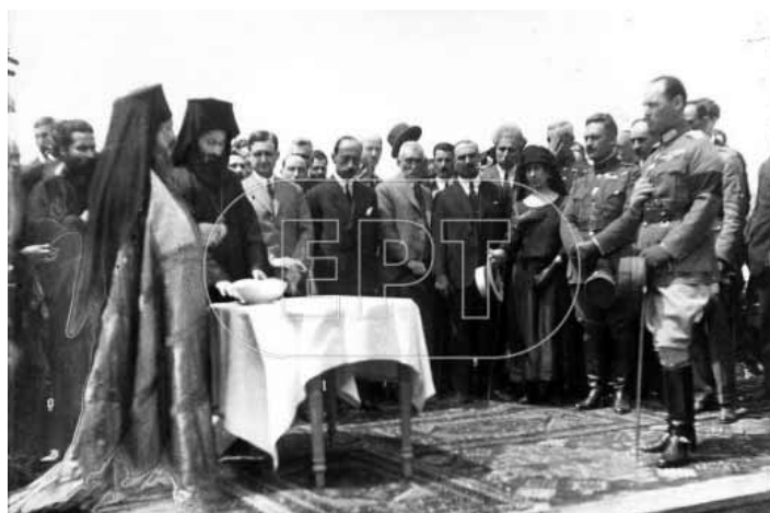
Όπως βλέπουμε στα εγκαίνια του προσφυγικού συνοικισμού του Βύρωνα, το 1923 η μορφή του ελληνικού κοινωνικού κράτους ήταν σαφώς επηρεασμένη από το τι ήταν το ελληνικό κράτος.