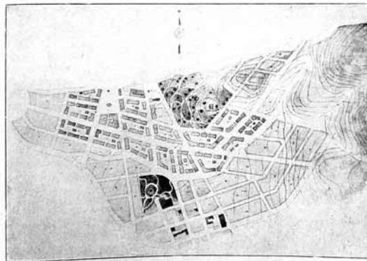
Εἰς. 1.—Γενικὸν διάγραμμα τοῦ συνοικισμοῦ Βύρωνος.

Γενικό Το ζήτημα της ανέγερσης του προσφυγικού Συνοικισμού Βύρωνος άρκευθη το πρώτον κατά Νοέμβριον του 1922 παρ' ημών, δευτέροντος τότε την Γενικήν Έπιτροπήν του Υπουργείου Παιδείας, επί τῆς σκοπῆς εἰς τὴν ὀργανωτικὴν δύναμιν τοῦ ὅποιου ἀρκεύεται μὲν μέρος τοῦ συντελεσθέντος ἔργου, ὅμως ἐν συνερῶν μετ' ἡμῶν προῆλθ' εἰς τὰς ἐκτελεστέας ἐνεργείας πρὸς ταχέαν ἐναρξίν τῶν ἔργων. Ἀνευρέθη τότε τὸ παρὰ τὴν Ἀνάληψιν (Παγκρατίου) γήπεδον τοῦ Δημοσίου, ἐκτετατικῶς περὶ τοῦ 114 στρεμ-