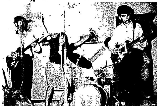
«Τηνέπτερο» εν δράσει!.. Μή τοις φοβάσθε. «Σκάλος που γαυγίζει δεν διαγκώνει!»