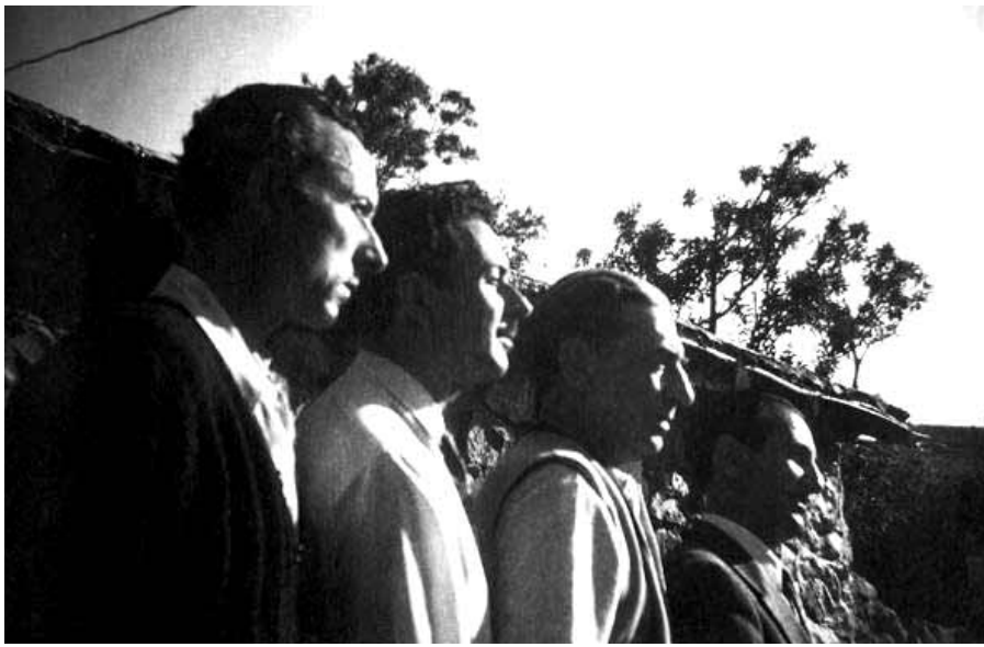
Από τα δεξιά προς τ' αριστερά: Μενέλαος Λουντέμης, Δημήτρης Φωτιάδης, Γιάννης Ρίτσος, Μάνος Κατράκης στην Μακρόνησο. Η στροφή προς τις τέχνες και τις επιστήμες αποτελούσε για πολλά χρόνια τη μόνη διέξοδο αριστερών που είχαν βρεθεί αποκλεισμένοι από το κράτος. Αυτή η παρακαταθήκη αποδείχθηκε στην συνέχεια πολύτιμη.

σκονταν σε πνευματική μυσταγωγία. Ούτε ηλεκτρικές κιθάρες, ούτε ενισχυτές. Οι μπουάτ ήταν το σημείο συνάντησης και διαμόρφωσης του μεταπολιτευτικού «πολιτικού τραγουδιού» που όλοι θέλοντας και μη κάποια στιγμή φάγαμε στην μάπα.