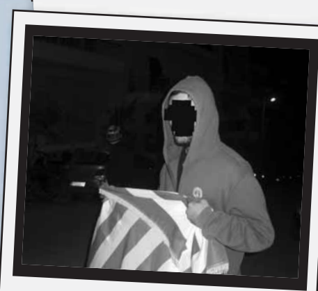
Trial and error: the antifa way

Λέγαμε στο κυρίως κείμενο ότι η εξερεύνηση του Γαλατσίου δεν είχε μόνο συλλογή στοιχείων για το χώρο. Ταυτόχρονα ήταν και μύηση στα ενδότερα της ντόπιας φασιστικής πανίδας, γεγονός που είχε κι αυτό την πλάκα του. Για παράδειγμα, όταν η συλλογή πληροφοριών έφτανε σε ώριμο στάδιο αποφασίζαμε να εξακριβώσουμε τις υποψίες μας με τη μέθοδο trial and error. Το παράδειγμα στις φωτογραφίες είναι χαρακτηριστικό: εντοπισμός φασιστοστενού ή φασιστοπολυκατοικίας, προκλητικό σύνθημα μες στα μούτρα, χρονομέτρηση φασιστοαντίδρασης, εξαγωγή συμπεράσματος και πάμε παρακάτω. Αγαπημένη παραλλαγή της ίδιας μεθόδου αποτελούσε το ψείρισμα των σημαιοστολισμένων μπαλκονιών. Διάφοροι ναζί έχαναν τις σημαίες τους σε ανύποπτο χρόνο, γεγονός που σε πρώτη φάση τους τσάντιζε. Σε περίπτωση που η σημαία αντικαθίστατο άμεσα, το ψείρισμα συνεχιζόταν, πράξη με άγνωστες, πλην σίγουρες ψυχολογικές συνέπειες στο ναζι ιδιοκτήτη τους.