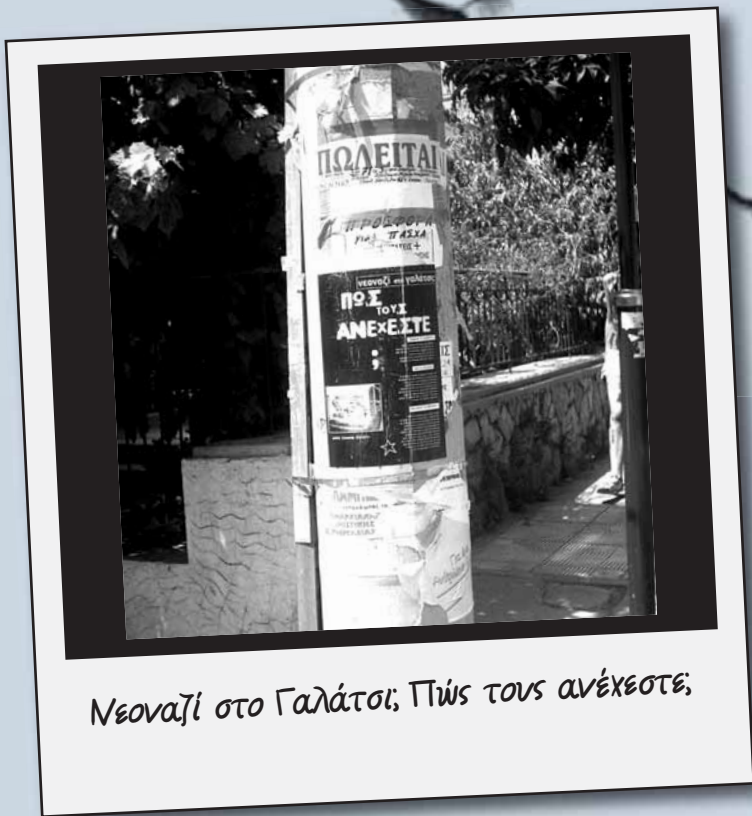
Νεοναζί στο Γαλάτσι; Πώς τους ανέχεστε;

Ήταν Ιούνης του 2007. Οι ναζί στο Γαλάτσι ξεσάλωναν ήδη για κανά χρόνο. Στη γειτονιά δεν υπήρχαν οργανωμένοι δικοί μας. Εμείς είχαμε ξεκινήσει τις πρώτες βόλτες, σβήναμε κάθε εβδομάδα, κάποιος είχαμε πιάσει δουλειά εκεί. Η πρώτη μας δημόσια εμφάνιση υπήρξε η μικρή αφίσα που βλέπετε στη φωτό. Μαύρο φόντο, μεγάλος κίτρινος τίτλος, φωτό με τα συνθήματα των ναζί και γενικό νόημα «οι ναζί αλωνίζουν, εμείς δε θα τους αφήσουμε, οργανωθείτε». Ακριβώς επειδή είχαμε γυρίσει τη γειτονιά πάρα πολλές φορές, μέρα και νύχτα, και βασικά επειδή είχαμε ήδη από τότε τη γνώμη ότι ο λόγος έχει σημασία, χωρίσαμε το Γαλάτσι σε μικρότερους τομείς, κι φτιάξαμε ένα πλάνο αφισκοκόλλησης που κάλυπτε όλη την περιοχή, οικοδομικό τετράγωνο το οικοδομικό τετράγωνο. Για όποιον καταλάβαινε τη σημασία τέτοιων κινήσεων το αποτέλεσμα ήταν εντυπωσιακό. Σε κάθε απίθανο σημείο του Γαλατσίου υπήρχε κολλημένη μια αφίσα που έθετε ανοιχτά το ζήτημα των ναζί και της αντιμετώπισής τους. Βέβαια το ζήτημα δεν ήταν η αφίσα καθαυτή. Το ζήτημα ήταν ότι η συγκεκριμένη αφίσα ερχόταν σαν το επόμενο βήμα, ύστερα από ένα μαραθώνιο υπόγειας δουλειάς απέναντι στους ναζί.