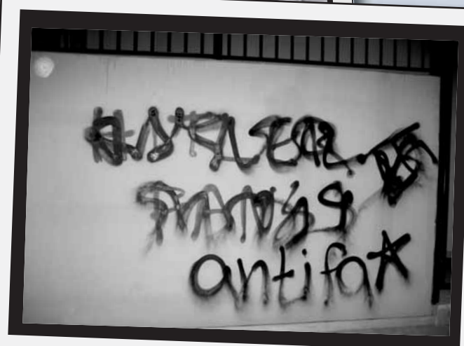
Hitler fans fuck off