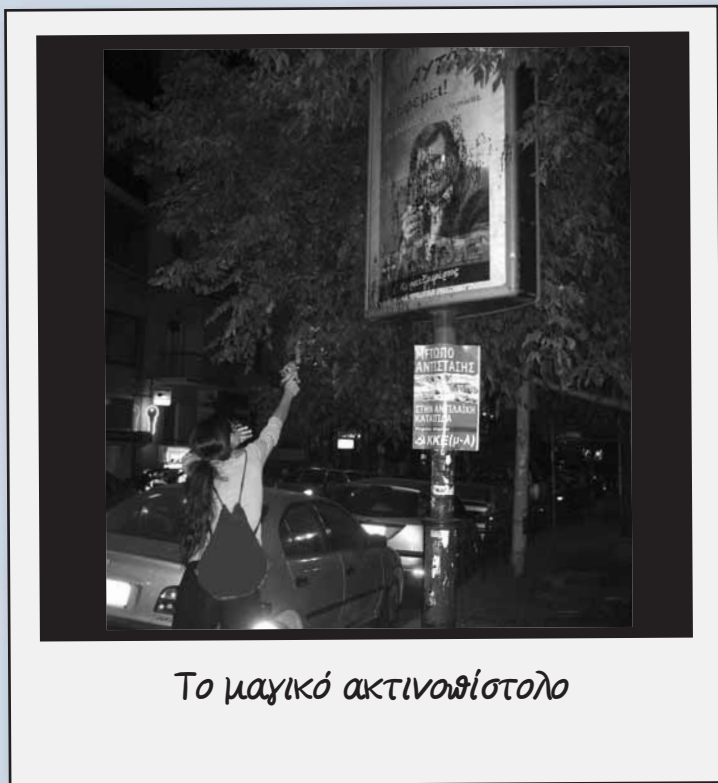
Το μαγικό ακτινοβόιστολο

Ήταν Ιούνης του 2007. Οι ναζί στο Γαλάτσι ξεσάλωναν ήδη για κανά χρόνο. Στη γειτονιά δεν υπήρχαν οργανωμένοι δικοί μας. Εμείς είχαμε ξεκινήσει τις πρώτες βόλτες, σβήναμε κάθε εβδομάδα, κάποιος είχαμε πιάσει δουλειά εκεί. Η πρώτη μας δημόσια εμφάνιση υπήρξε η μικρή αφίσα που βλέπετε στη φωτό. Μαύρο φόντο, μεγάλος κίτρινος τίτλος, φωτό με τα συνθήματα των ναζί και γενικό νόημα «οι ναζί αλωνίζουν, εμείς δε θα τους αφήσουμε, οργανωθείτε». Ακριβώς επειδή είχαμε γυρίσει τη γειτονιά πάρα πολλές φορές, μέρα και νύχτα, και βασικά επειδή είχαμε ήδη από τότε τη γνώμη ότι ο λόγος έχει σημασία, χωρίσαμε το Γαλάτσι σε μικρότερους τομείς, κι φτιάξαμε ένα πλάνο αφισκοκόλλησης που κάλυπτε όλη την περιοχή, οικοδομικό τετράγωνο το οικοδομικό τετράγωνο. Για όποιον καταλάβαινε τη σημασία τέτοιων κινήσεων το αποτέλεσμα ήταν εντυπωσιακό. Σε κάθε απίθανο σημείο του Γαλατσίου υπήρχε κολλημένη μια αφίσα που έθετε ανοιχτά το ζήτημα των ναζί και της αντιμετώπισής τους. Βέβαια το ζήτημα δεν ήταν η αφίσα καθαυτή. Το ζήτημα ήταν ότι η συγκεκριμένη αφίσα ερχόταν σαν το επόμενο βήμα, ύστερα από ένα μαραθώνιο υπόγειας δουλειάς απέναντι στους ναζί.