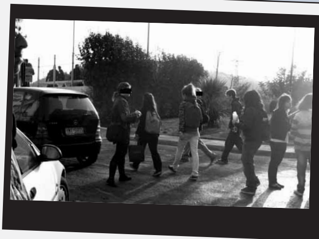
Το Μάρτη του 2008 επανερχόμαστε με το δεύτερο έντυπο και μπόνους τετρασέλιδο, στο οποίο εξηγούμε τι συνέβη κατά τη διάρκεια του πρώτου μοιράσματος. Ξανά ανακατωσούρα.