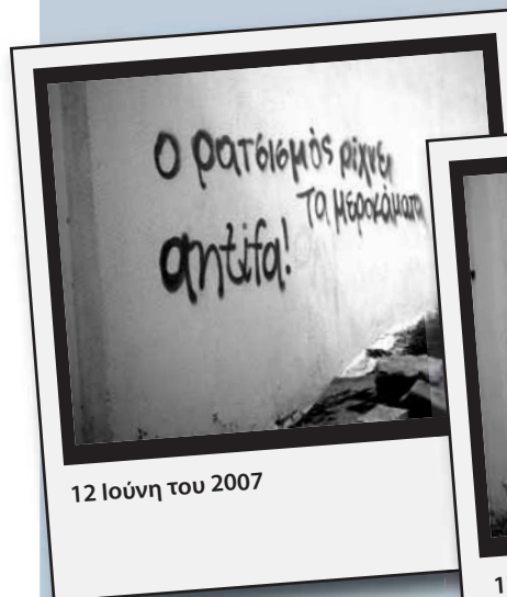
12 Ιούνη του 2007

Ο πυρήνας antifa 66 υπήρξε μία απ' τις ελάχιστες αυτοοργανωμένες ομάδες, που φτιάχτηκε βάσει σχεδίου. Η βασική ιδέα που βρισκόταν πίσω από κάθε κίνηση και δημόσια εμφάνιση του πυρήνα ήταν η εκμετάλλευση της πόλωσης που έφτιαχνε η αντιπαράθεση με τους ναζί στη γειτονιά του Γαλατσίου. Η ιδέα πήγαινε ως εξής: κάθε καπιταλιστική κοινωνία διατρέχεται από ένα ταξικό ρήγμα που τη χωρίζει στα δύο, κάθε πεδίο του κοινωνικού είναι ένα πεδίο ακήρυχτου πολέμου, κάθε ταξική ισορροπία είναι ένα συνεχές διακύβευμα. Κατά συνέπεια τι γίνεται αν μια οργανωμένη ομάδα, οσοδήποτε μικρή κι αν είναι, αναγνωρίσει αυτό το ρήγμα και χωθεί εντός του; Αν καταλάβει αυτόν τον πόλεμο και κοιτάξει να τον οξύνει; Αν βρει τις ισορροπίες και τις τσιγκλήσει με το δάχτυλο;