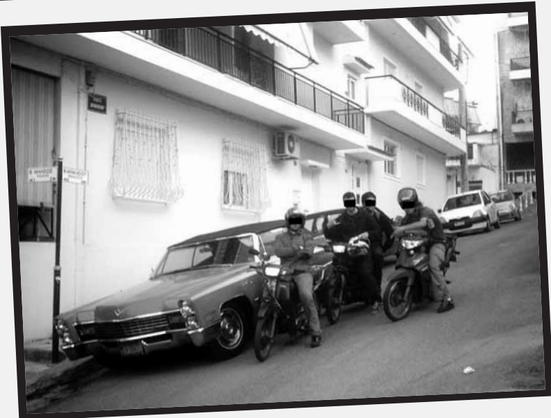
Η ροζ Κάντιλακ

Η πρώτη ιδέα που πέρασε απ' τα κεφάλια μας γύρω απ' το «τι να κάνουμε» δεν ήταν η δημιουργία antifa πυρήνα. Η πρώτη ιδέα περιλάμβανε γύρες στα στενά του Γαλατσίου, εξοικείωση με την άτασλη ρυμοτομία της γειτονιάς, εντοπισμό και καταγραφή πλατειών, σχολείων, πάρκων. Σε μια απ' αυτές τις γύρες, στο μεσαίο χώρο ανάμεσα στην Τραλλέων και τη Γαλατσίου, πέσαμε πάνω σε μια παρκαρισμένη Κάντιλακ. Η πεντάμετρη ροζ λαμαρίνα μας είχε κάνει τότε τόση εντύπωση που σταματήσαμε για λίγο να ποζάρουμε μπροστά της. Ξέρετε, σε φάση what the fuck? Με τα μάτια του τότε, το όλο σκηνικό είχε κάτι το αστειό: ένα παροπλισμένο αμερικανικό κήτος πέντε δεκαετιών σε μια ανηφόρα στου διαόλου τη μάνα. Δέκα χρόνια μετά η ίδια σκηνή μας φαίνεται εξόχως διδακτική: οι έτοιμες γνώμες για τον κόσμο, οι κληρονομημένες βεβαιότητες για τις κοινωνίες μας καταρρέουν κάθε φορά που τις σκαλίζουμε, κάθε φορά που τις αμφισβητούμε, κάθε φορά που οργανωνόμαστε εναντίον τους. Και είναι σε τέτοιες στιγμές που οι ροζ Κάντιλακ στις ανηφόρες του Γαλατσίου υπονοούν ότι υπάρχουν πράγματα που, μέχρι να ξεκινάς να τα κοιτάς από τα μέσα, δεν φανταζόσουν καν ότι υπάρχουν.