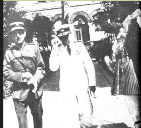
Μπανανία με φουστανέλες

Ε ναι, αυτό είναι η ιστορία, όπως θα λέγαμε και στην προηγούμενη ενότητα. Όπως όμως διαπίστωσε ο Μπένγιαμιν, αν η ιστορία μπορεί να κατασκευάζει κόσμους, η πραγματικότητα της διαρκούς έκτακτης ανάγκης μπορεί να τους γκρεμίζει. Ευτυχώς για τους εδώ σκοπούς μας, τα «συμπεράσματα» του βιβλίου του Τσουκαλά διέθεταν μια τελευταία παράγραφο εξαιρετικά διαφωτιστική όσον αφορά το τμήμα που έπρεπε να πληρώσει όποιος υιοθετούσε την Τσουκαλική ιστορία: