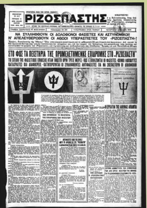
Φασίστες στον ελληνικό μεσοπόλεμο

Ο Αλέξανδρος Παπάγος και ο Ναύαρχος Δημήτρης Οικονόμου το πρωί της διοργάνωσης του πραξικοπήματος του στρατηγού Κονδύλη, ετοιμάζονται να απαγάγουν τον πρωθυπουργό. Οι ίδιοι ήταν οι συγγραφείς της έκθεσης «η Θέση της Ελλάδος σε περίπτωση αγγλοϊταλικού πολέμου». Η δεύτερη θέση του Γαλανόμαυρου ήταν η συνέχεια των κρατικών σκοπών πέρα από τις «αλλαγές πολιτεύματος», ειδικά όταν πρόκειται για σκοπούς εξωτερικού