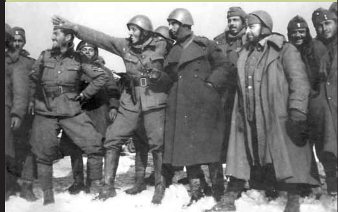
Το μεγάλο πατριωτικό έπος

Σταματήσαμε το Γαλανόμαυρο γιατί η απάντηση των ιστορικών ζητημάτων που θέτει η σημερινή εποχή στη δεκαετία του '40, έγινε πολύ βαριά για τις πλάτες μας. Θα συνεχίσουμε το Γαλανόμαυρο γιατί αυτά τα ίδια ερωτήματα μπορούν να απαντηθούν ξεκινώντας με αναφορά σε άλλες ιστορικές περιόδους. Ελπίζουμε ότι αυτή η αναστροφή θα λειτουργήσει με τον τρόπο που λειτουργήσει έως τώρα. Θα μαθαίνουμε όλο και περισσότερα, θα κατανοούμε όλο και καλύτερα, θα ωριμάζουμε. Τελικά θα ξαναγυρίσουμε στη δεκαετία του '40 όταν νιώσουμε έτοιμοι. Ή όταν νομίσουμε ότι τα ζητήματα που θέτει το παρόν μπορεί να απαντηθούν μέσω αυτής της περιόδου. Κατά τα άλλα το ζήτημα που θα συνεχίσει να μας απασχολεί στα επόμενα είναι το ζήτημα της ηγεσίας και της βάσης του εργατικού κινήματος. Ελπίζουμε να έγινε αντιληπτό ότι αυτή η αλλαγή της περιόδου, στην πραγματικότητα σημαίνει ότι το «Γαλανόμαυρο», ως στόχοι, μέθοδοι και πολιτική λειτουργία παραμένει ακριβώς ως έχει. Και ελπίζουμε η υποστήριξη που απολαύσαμε ως τώρα να συνεχιστεί.