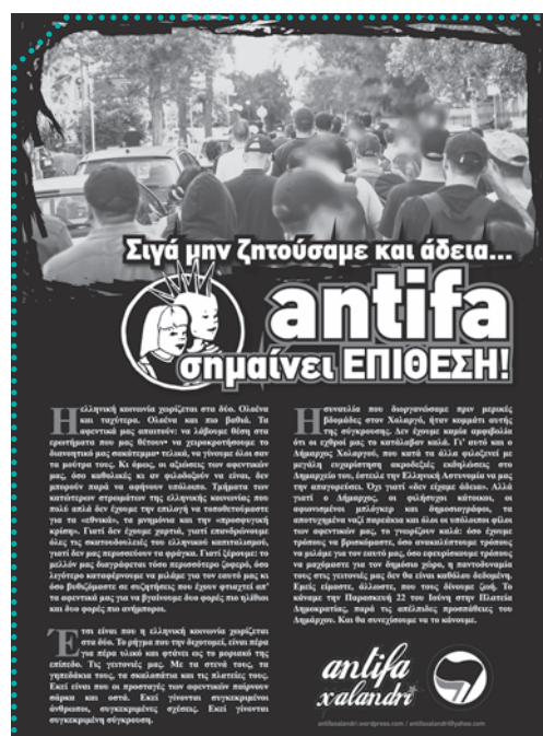
Αφίσα που κολλήθηκε από το antifa Xalandri μετά την αποτυχημένη απαγόρευση και την πετυχημένη συναυλία.

Όταν οι μπάτσοι μάς ανακοίνωσαν ότι «απαγορεύομασταν» έπρεπε να πάρουμε μια γρήγορη απόφαση. Το κάναμε «στα γρήγορα». Αλλά αυτό το «στα γρήγορα» τελικά βγήκε μετά από χρόνια τριβής με το δημόσιο χώρο, την πολιτική οργάνωση και τις γνώμες για τη δημόσια τάξη. Γνωρίζαμε από πριν ότι η δημόσια τάξη έχει επίπεδα. Η απαγόρευση ενώπιον της οποίας ήρθαμε αντιμέτωποι μας φάνηκε όχι και τόσο «κάθετη», παρά το «αμάσχητο» ύψος των χακίδων. Κατάλαβαίναμε από πρώτο χέρι ότι άλλο πράγμα η ανακοίνωση της απαγόρευσης και άλλο πράγμα η επιβολή της. Αποφασίσαμε να μπορούμε όλοι κι όλες μαζί στην πλατεία και να διαπιστώσουμε πόσο μακριά μπορούσε να φτάσει η απαγόρευση. Είχαμε τη γνώμη ότι μια επίθεση μετά δακρυγόνων εναντίον μας τελικά θα δημιουργούσε περισσότερα προβλήματα στη δημοτική αρχή, απ' αυτά που υποτίθεται ότι θα έλυνε. Ξεκινήσαμε να στήνουμε το live πλάι σ' ένα ποτάμι εντολών που πηγαινοερχόντουσαν. Η ΓΑΔΑ στους Ματάδες, το τοπικό Α.Τ. στους καπελάκηδες, ο δήμαρχος στον εκπρόσωπό του κλπ κλπ. Όταν τελικά, οι άσχετοι με τη συναυλία αποχώρησαν η ντόπια πανίδα πλημμύρισε την πλατεία. Κάποιες εκατοντάδες αντιφασίστες κι αντιφασίστριες από τα σχολεία και τις πλατείες της περιοχής, από την τοπική κερκίδα και από τις γύρω περιοχές έκαναν για λίγες ώρες την πλατεία Δημοκρατίας ένα πολύ φιλόξενο antifa σημείο.