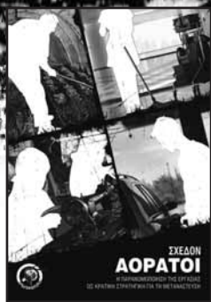
Σχεδόν Αόρατοι α' έκδοση Οκτώβρης 2009