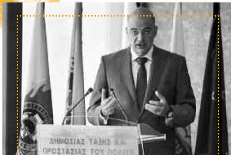
Ο Δένδιας ανακοινώνει ότι ο κρατικός αντιφασισμός νίκησε.

Ο φασισμός στήνει στα πόδια τους στρώματα κατεστραμμένα από την κρίση, μετατρέποντάς τα σε πολιορκητικό κριό κατά του οργανωμένου εργατικού κινήματος και της αριστεράς. Η ηγεσία της Χρυσής Αυγής επιχείρησε να χτίσει έναν ιδιωτικό στρατό, επίλεκτο τμήμα του οποίου ήταν η Ασφάλεια της Νίκαιας, που δοκίμασε την ισχύ του σε βάρος των πιο αδύναμων της κοινωνίας, των μεταναστών, για να συγκρουστεί στη συνέχεια με τον πραγματικό εχθρό του φασισμού: τους συνδικαλιστές, την αριστερά, την αντιφασιστική νεολαία. Το ανθρώπινο υλικό για τον στρατό αυτό η ηγεσία της Χρυσής Αυγής, που κατοικεί στα βόρεια προάστια της Αττικής και οικονομικά είχε πάντοτε τον τρόπο της, το βρήκε στις γειτονιές της Νίκαιας