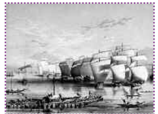
Λιθογραφία του 1850, η οποία αναπαριστά τον «στόλο του οπίου»: πλοία που μεταφέρουν όπιο από την Ινδία προς άλλες περιοχές της Ασίας. Οι Άγγλοι επισήμως απαγόρευαν στα εμπορικά τους πλοία να διακινούν όπιο, εντούτοις ήταν αυτοί που ήλεγχαν με το ναυτικό τους την εμπόριο και την παραγωγή του.

Η ιστορία της αγγλικής αποικιοκρατίας και των εμπορικών ανταγωνισμών κατά τον 19ο αιώνα μάς διδάσκει ότι η ναυτική υπεροχή οδήγησε στον έλεγχο όχι μόνο του εμπορίου, αλλά και του λαθρεμπορίου και μάλιστα σε πλανητική κλίμακα. Το εμπόριο και το λαθρεμπόριο ήταν οι δύο όψεις του ίδιου νομίσματος, συνυπήρχαν και συνυπάρχουν στους εμπορικούς δρόμους. Η εκάστοτε ναυτική υπερδύναμη του πλανήτη δεν ασκεί έλεγχο μόνο στο εμπόριο, αλλά και στο λαθρεμπόριο. Για την ακρίβεια, το ποιος ελέγχει το λαθρεμπόριο μπορεί να μην προβλέπεται από καμία διακρατική συμφωνία. Παρά μόνο να υπαγορεύεται από το δίκιο του ισχυρού.