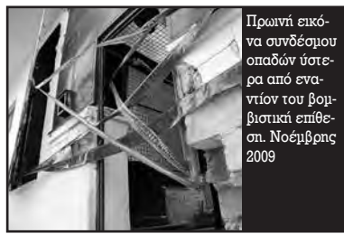
Πρωινή εικόνα συνδέσμου οπαδών ύστερα από εναντίον του βομβιστική επίθεση. Νοέμβριος 2009