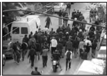
Σύντομο ραντεβού ολυμπιακών και παναθηναϊκών στο Παγκράτι. Μολότοφ, σπλό, μαχαίρια, σιδηρόβεργες αποτέλεσαν το ρεπερτόριο των εργαλείων που χρησιμοποιήθηκαν. Οι δημοφιλείς που ήταν παρούσες από την αρχή της συμπλοκής, αρχικά παραμέρισαν για να ανταλλαχτούν τα πυρά και επενέβησαν μόνο όταν άρχισε το κυνηγητό με τα μαχαίρια. Περίεργα πράγματα...