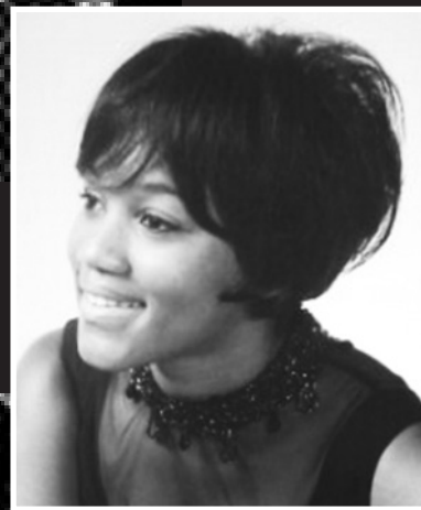
Στη φωτό: η Gloria Jones που ερμήνευσε την πρώτη εκδοχή του (υπερδίσκου πλέον) Tainted Love, το 1965. Το κομμάτι αυτό (ένα b side σε κάποιο τυχαίο 45αρι που πάτωσε εμπορικά σε ΗΠΑ και Βρετανία) μετατράπηκε σε underground χιπ 8 χρόνια αργότερα, όταν ο βρετανός Dj Richard Searling αγόρασε μια κόπια σε ταξίδι του στην Αμερική για να το λιώσει μετά την επιστροφή του στα club Va Va's και Wigan Casino. Το 1981, το τραγούδι θα φτάσει στο νούμερο ένα του βρετανικού καταλόγου διασκευασμένο απ' το synth-pop σχήμα των Soft Cell. (Στμ.)

δή καταφέρνει και συλλαμβάνει εκείνο τον έντονο δραματικό δεσμό ανάμεσα στην προσωπική κατάθεση περί θριάμβου, έρωτα ή απόγνωσης (όπως αυτή περιγράφεται μέσα από τους στίχους) και στις ξεσηκωτικές χορογραφίες που η μουσική αυτή είναι ικανή να υποστηρίξει. (για παράδειγμα το "Baby, without you" του Danny Monday ή το εκστατικό "I just can't live my life (without you babe)" της Linda Jones, είναι deep soul δίσκοι κατάλληλοι για χορό). Το δεδομένο πάθος των φαν προστατεύει τη σκηνή απ' την εισβολή της μόδας αλλά παράλληλα το να κρατιέται η επαφή με όλους τους πρόσφατους σημαντικούς δίσκους -πολλοί από τους οποίους συγκαλύπτονται με ψεύτικα ονόματα από τους djs - είναι πολύ σκληρή δουλειά. "Καθαρή έρευνα", όπως μου είπε ένας οπαδός.