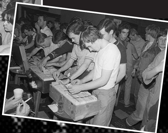
Wigan casino 2. Η συντριπτική πλειοψηφία των δίσκων που αποτέλεσαν τα σουξέ της northern soul (κατά βάση 45άρια και demos) ήταν ηχογραφήσεις που είχαν αγνοηθεί ή αποτύχει εμπορικά στις ΗΠΑ. Στη φωτό, μέλη της σκηνής ψάχνουν για τέτοια κομμάτια στο δισκοπωλείο που υπήρχε στον προθάλαμο του Wigan Casino. (Στμ.)