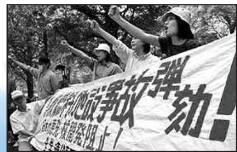
Αντιπυρηνική διαδήλωση στην Τοκαϊμούρα νότια του Τόκιο το 2000, ενάντια στην εγκατάσταση πυρηνικού εργοστασίου.