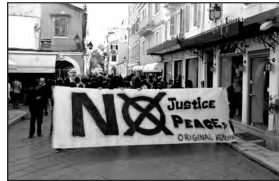
Μπλοκ της original Κέρκυρας σε απεργιακή διαδήλωση

- Είδαμε πάντως ότι διάφορα club της original έβγαλαν α-