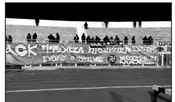
Αεκ φτώχεια προσφυγία ξεριζωμός - εχθρός ο φασισμός. Πανό από την Original Καβάλας