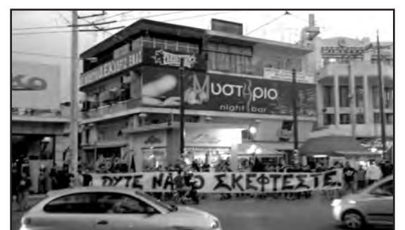
Μπλόκο της Original Περιστερίου σε ομιλία φασιστών δίπλα απ' το σύνδεσμό τους.