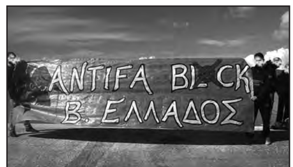
Πανό από βόρεια Ελλάδα