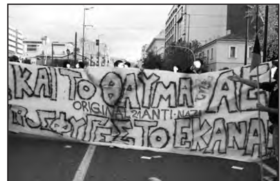
Αντιφασιστική διαδήλωση στην Αθήνα